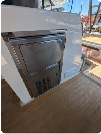
Cockpit ice maker