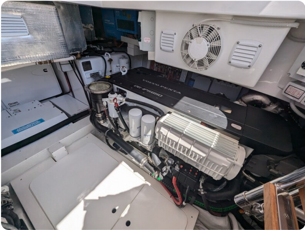
{1} Stbd engine