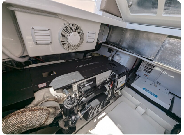
{1} Port engine