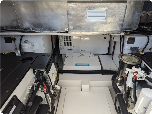
{1} Onan generator