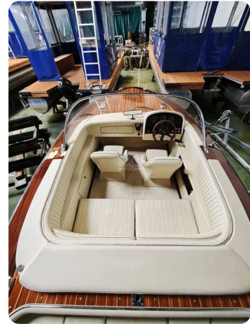
Boesch 590 Cabrio Deluxe CARPE DIEM 14