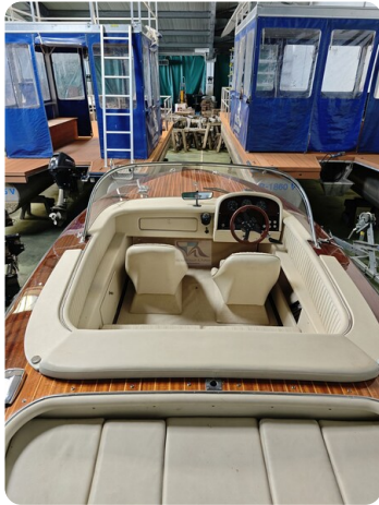
Boesch 590 Cabrio Deluxe CARPE DIEM 12