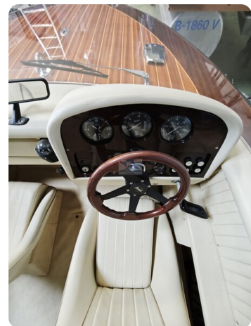
Boesch 590 Cabrio Deluxe CARPE DIEM 15