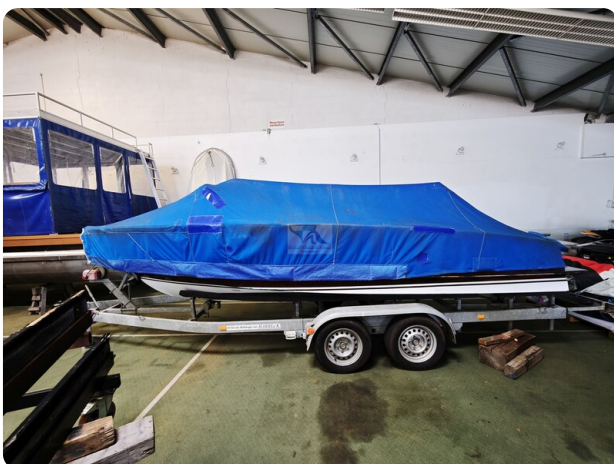
Boesch 590 Cabrio Deluxe CARPE DIEM 11