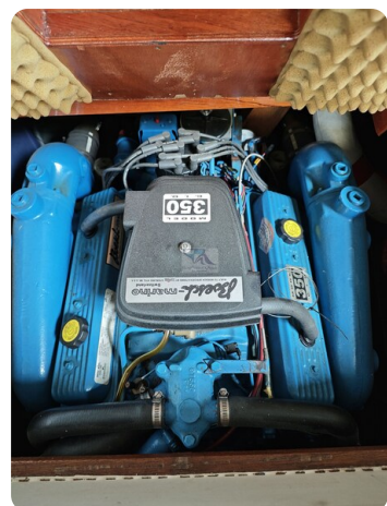
Boesch 590 Cabrio Deluxe CARPE DIEM 25