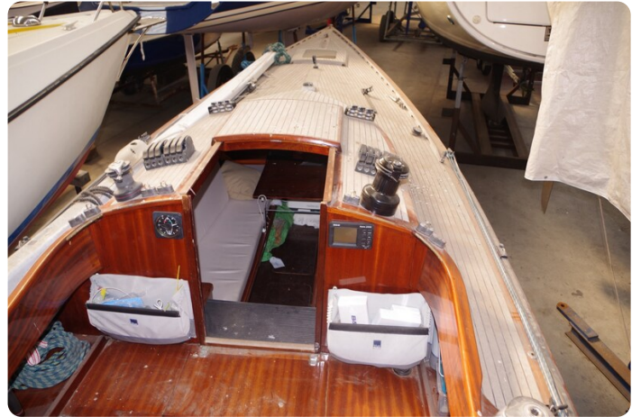
Schärenkreuzer FLORIAN 28