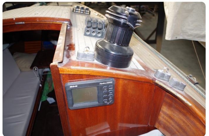
Schärenkreuzer FLORIAN 35