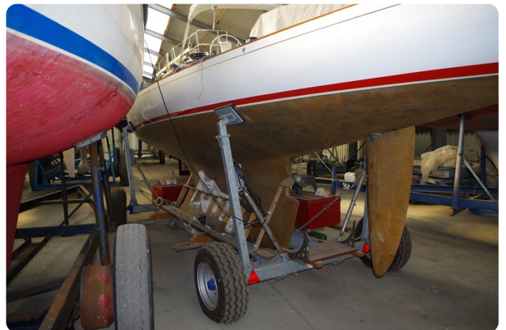
Schärenkreuzer FLORIAN 17