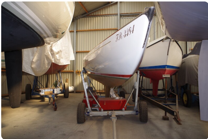
Schärenkreuzer FLORIAN 10