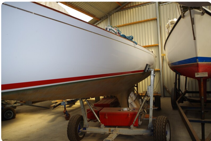
Schärenkreuzer FLORIAN 12