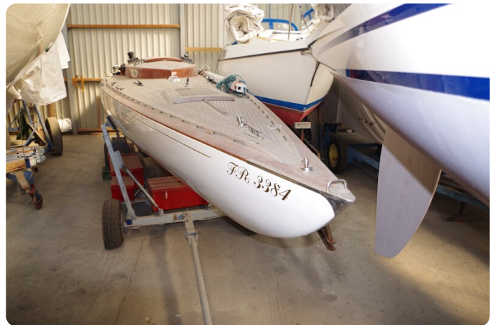
Schärenkreuzer FLORIAN 2