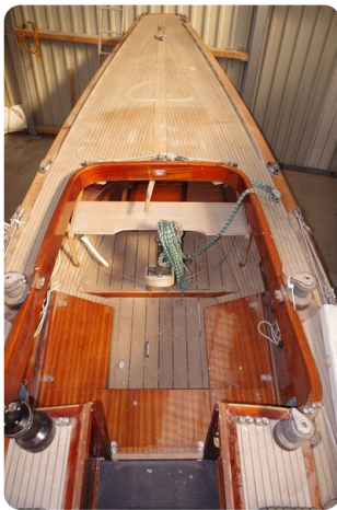
Schärenkreuzer FLORIAN 1