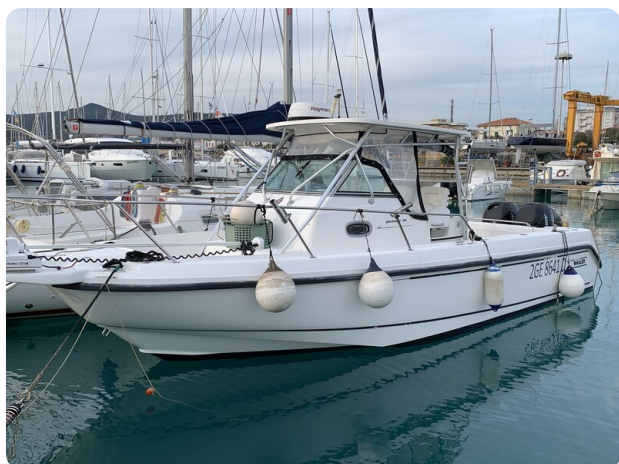
Boston 28 Outrage bow profile