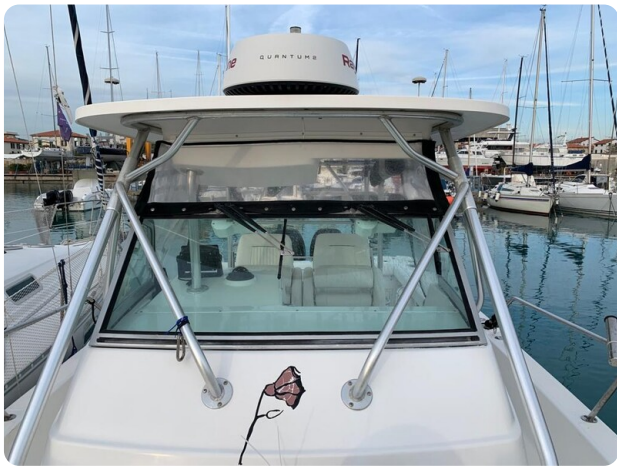
Boston 28 Outrage hard top detail