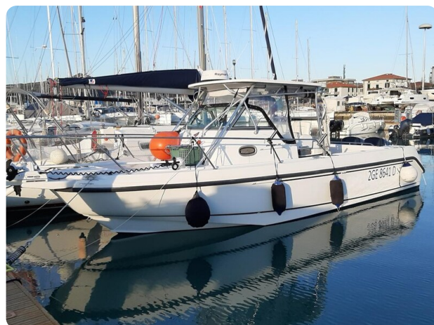
Boston 28 Outrage profile