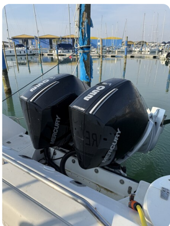
Boston 28 Outrage new engines