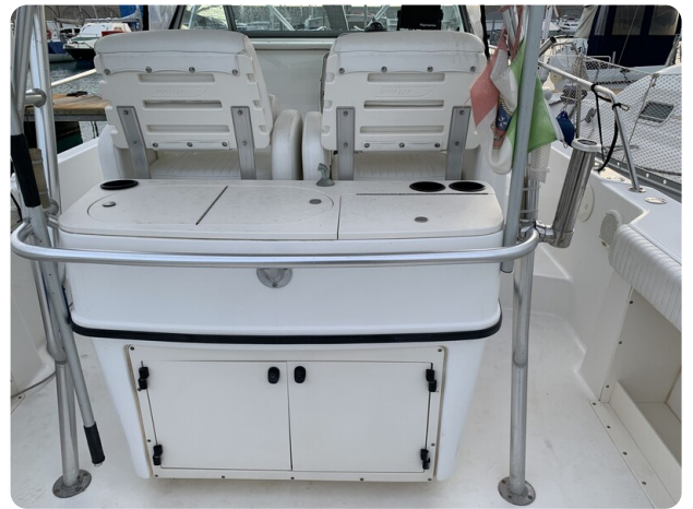
Boston 28 Outrage cockpit detail