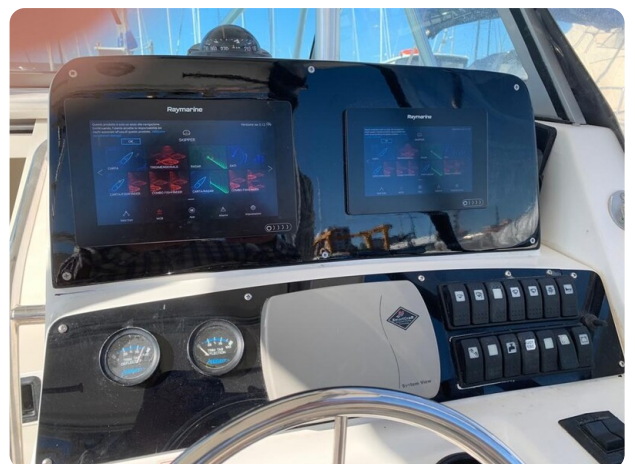
Boston 28 Outrage helm