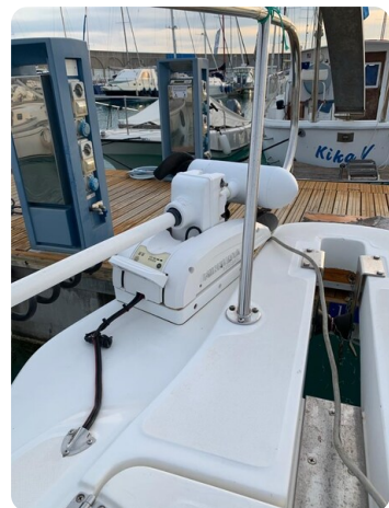
Boston 28 Outrage Minn Kota detail