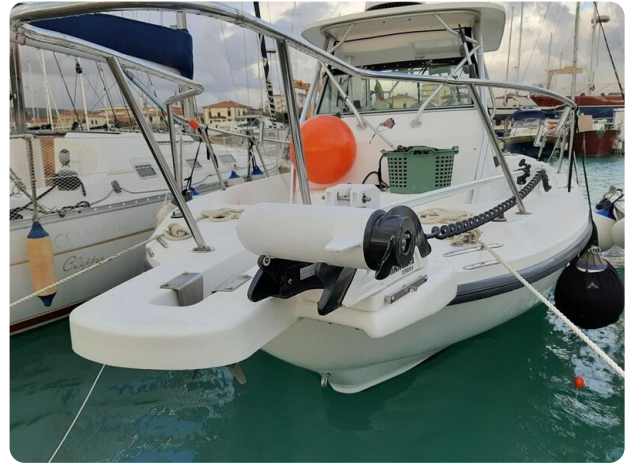
Boston 28 Outrage bow detail