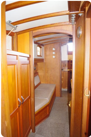
Bültjer Kutter msp625720 17