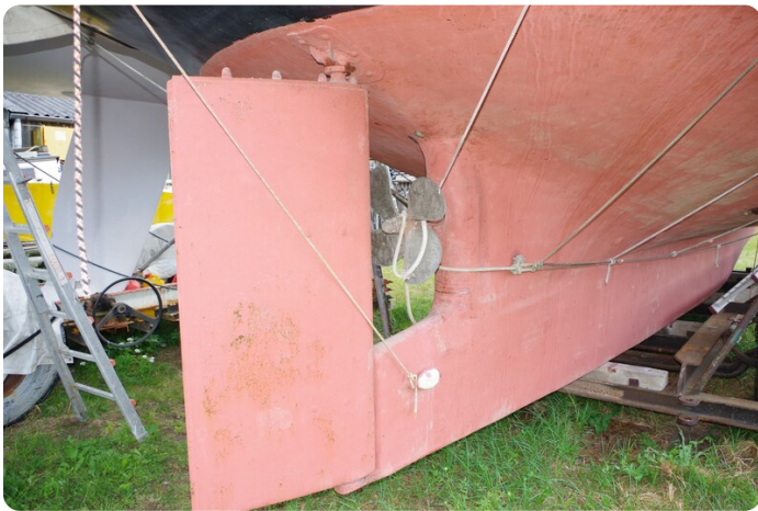
Bültjer Kutter msp625720 8