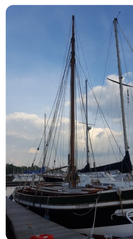
Bältjer Kutter msp625720 4