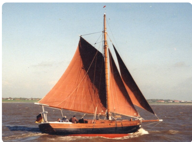
Bältjer Kutter msp625720 1