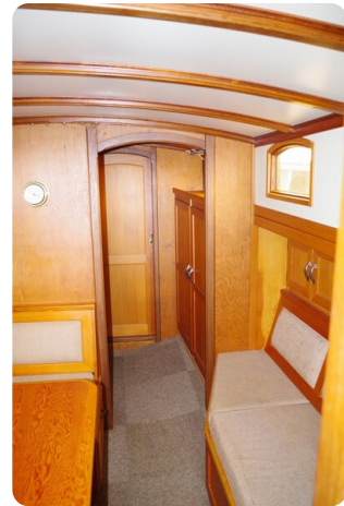
Bültjer Kutter msp625720 12