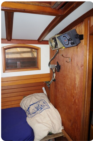
Bültjer Kutter msp625720 13