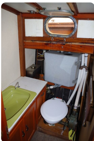
Bültjer Kutter msp625720 21