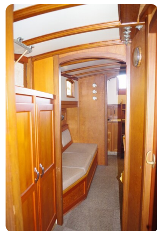
Bültjer Kutter msp625720 16