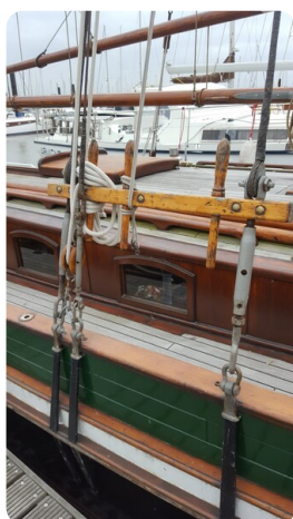
Bild3Bältjer Kutter msp625720 3