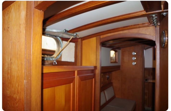
Bültjer Kutter msp625720 18