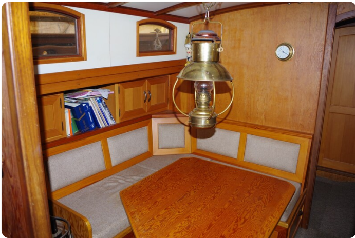
Bültjer Kutter msp625720 11