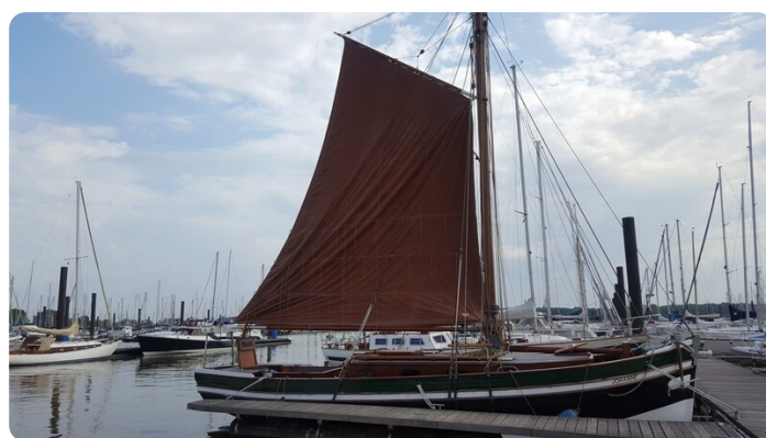
Bild1Bältjer Kutter msp625720 2