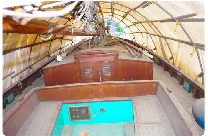
Bültjer Kutter msp625720