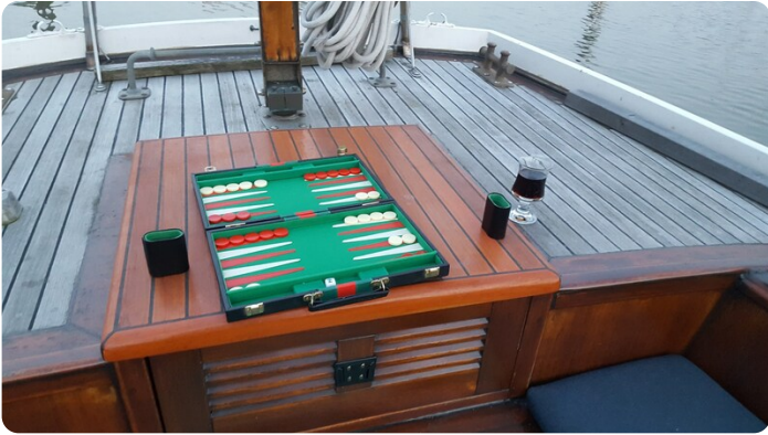
Bültjer Kutter msp625720 23