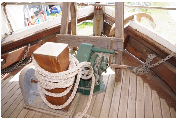
Bültjer Kutter msp625720 9