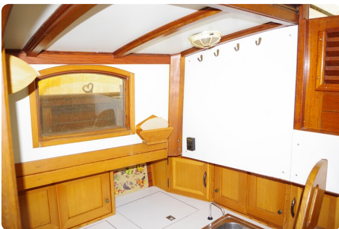
Bültjer Kutter msp625720 15