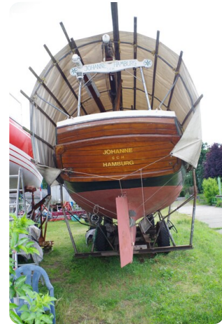
Bültjer Kutter msp625720 7