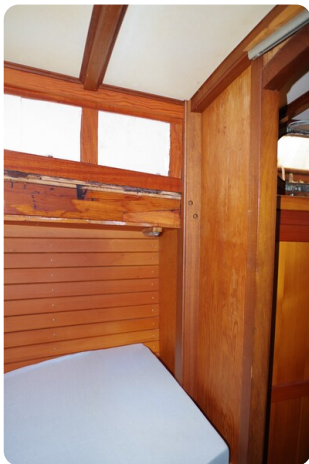
Bültjer Kutter msp625720 19