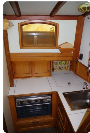
Bültjer Kutter msp625720 14