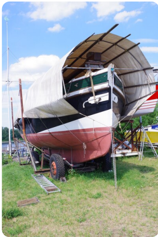
Bültjer Kutter msp625720 6