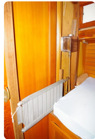
Bültjer Kutter msp625720 20