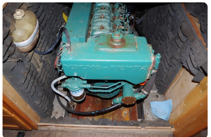
Bültjer Kutter msp625720 22