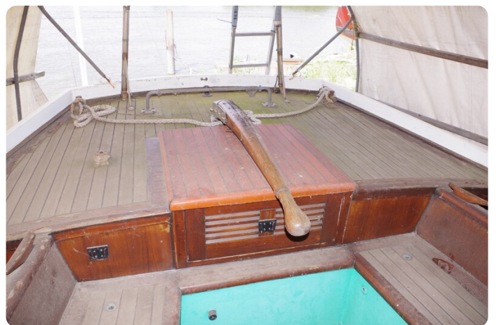
Bültjer Kutter msp625720 10