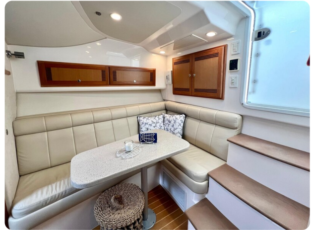
Cabo 32 Express dinette