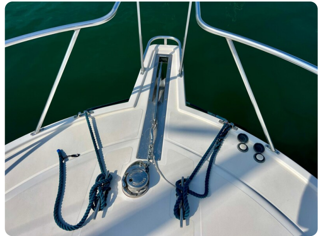
Cabo 32 Express bow pulpit