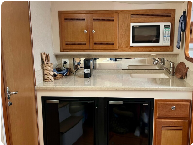
Cabo 32 Express galley view