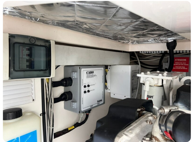
Cabo 32 Express, engine room