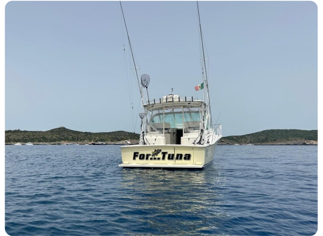
Cabo 32 Express, stern