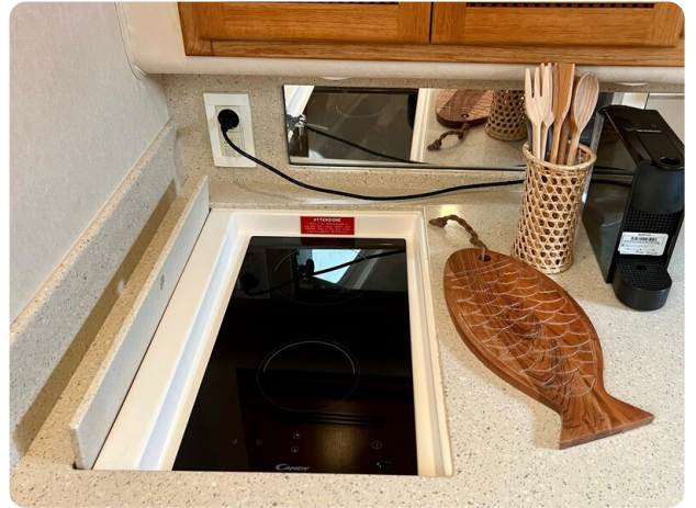
Cabo 32 Express cooktop