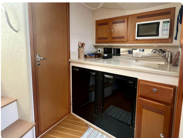
Cabo 32 Express galley