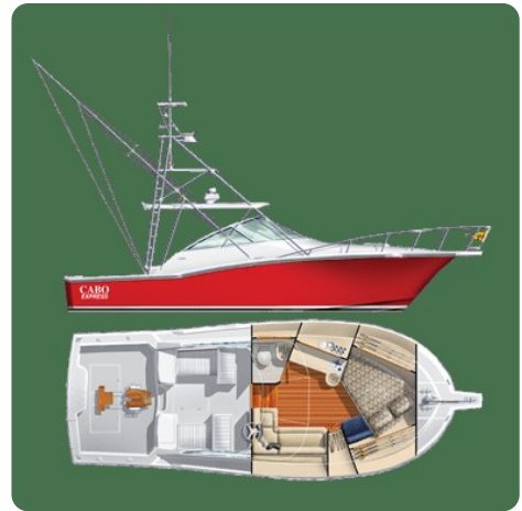
Cabo 32 Express, Layout