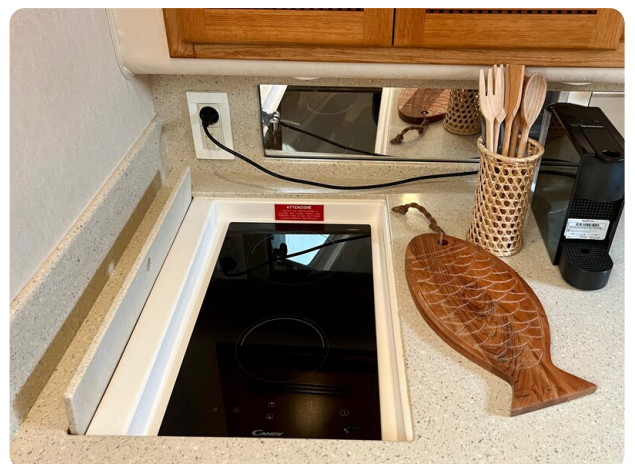
Cabo 32 Express cooktop