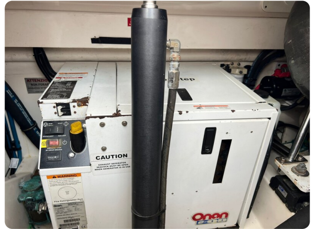
Cabo 32 Express, generator