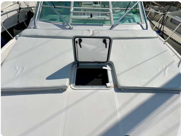
Cabo 32 Express fwd sunpad