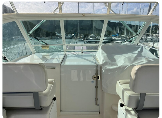
Cabo 32 Express, helm station area