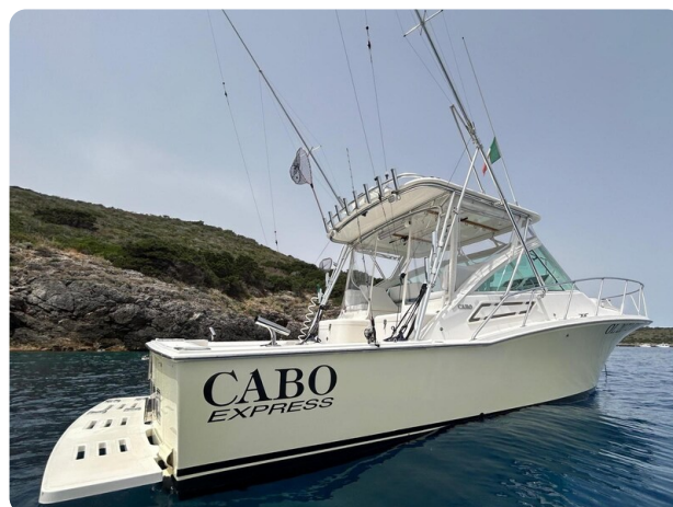
Cabo 32 Express, angle