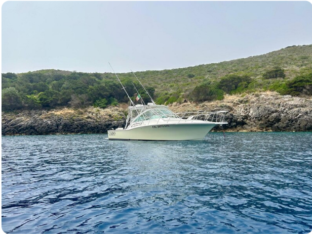
Cabo 32 Express, panoramic