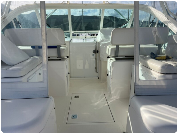
Cabo 32 Express, cockpit