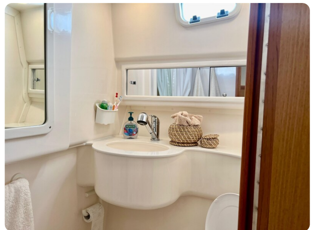
Cabo 32 Express bathroom