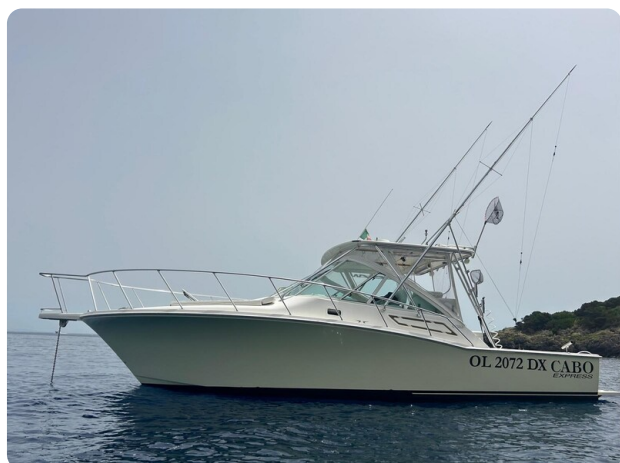
Cabo 32 Express, profile