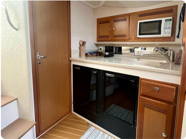
Cabo 32 Express galley