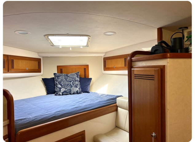
Cabo 32 Express cabin berth