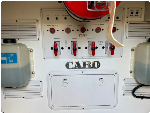
Cabo 32 Express, engine room detail