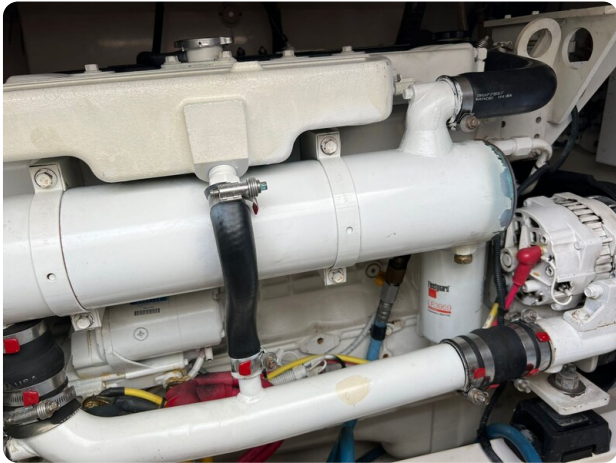
Cabo 32 Express, engine detail