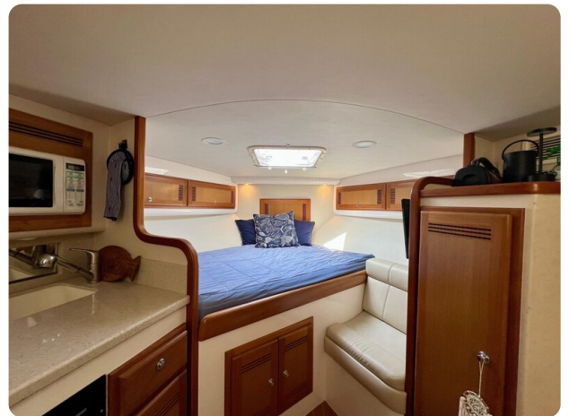
Cabo 32 Express cabin view