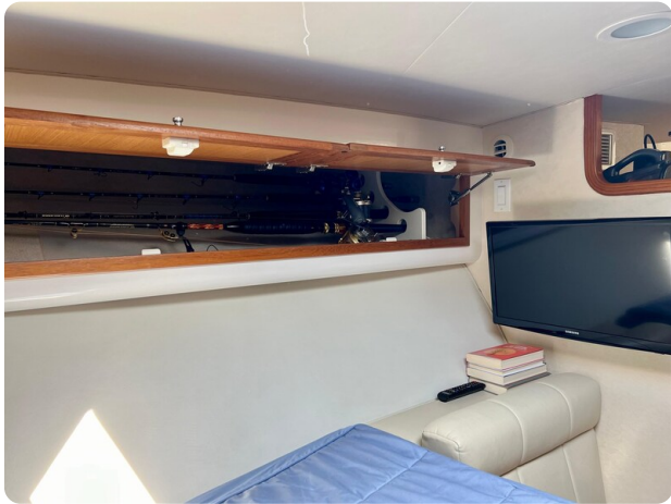
Cabo 32 Express dinette details