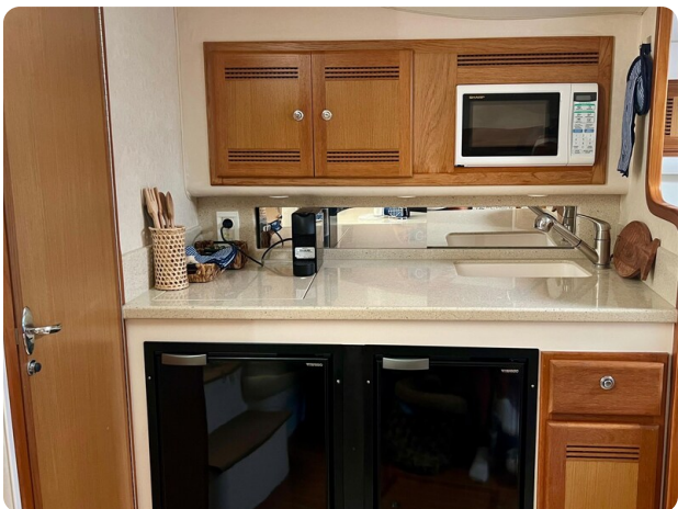
Cabo 32 Express galley view