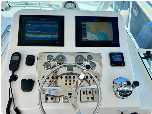
Cabo 32 Express helm