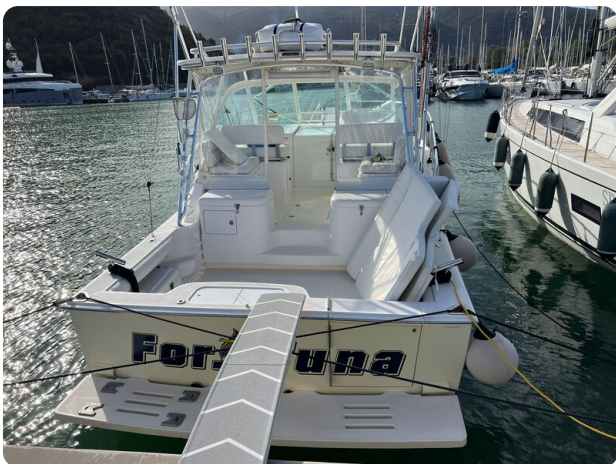
Cabo 32 Express, stern view