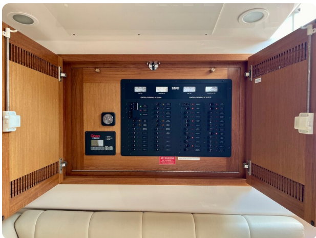
Cabo 32 Express electrical panel