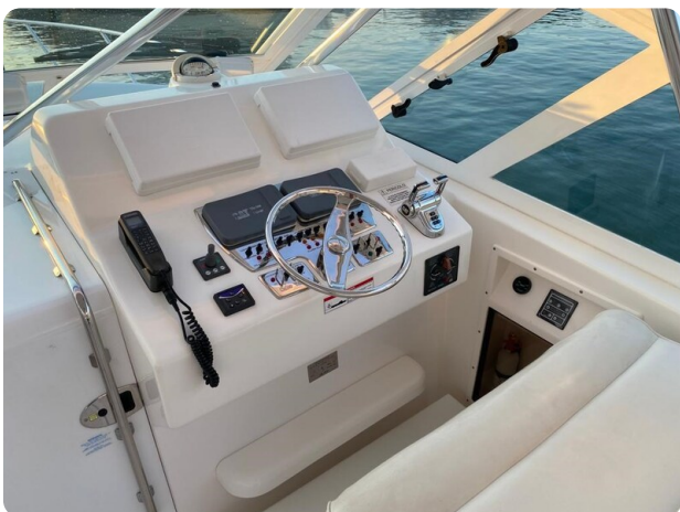
Cabo 36 Express helm station view