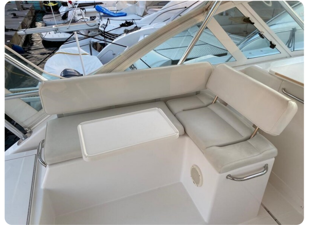
Cabo 36 Express cockpit dinette