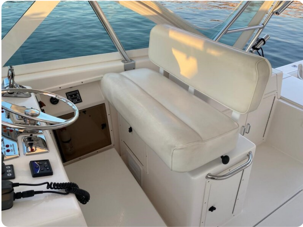
Cabo 36 Express helm station