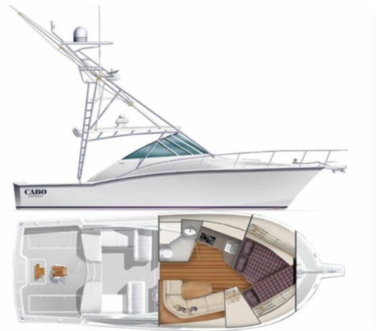
Cabo 36 Express layout