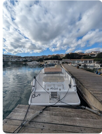
Canamer 33 stern view