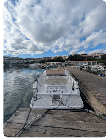
Canamer 33 stern view