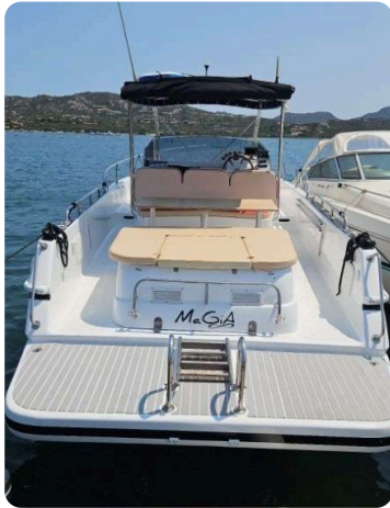
Canamer 33 ster view