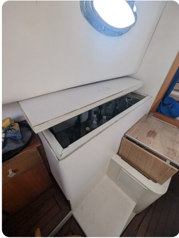
Canamer 33 details