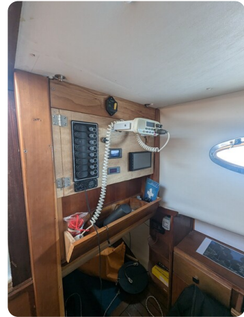
Canamer 33 detail