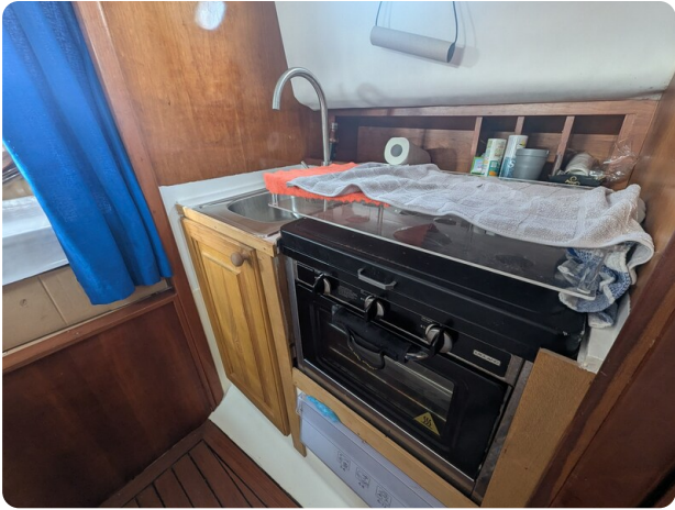
Canamer 33 galley