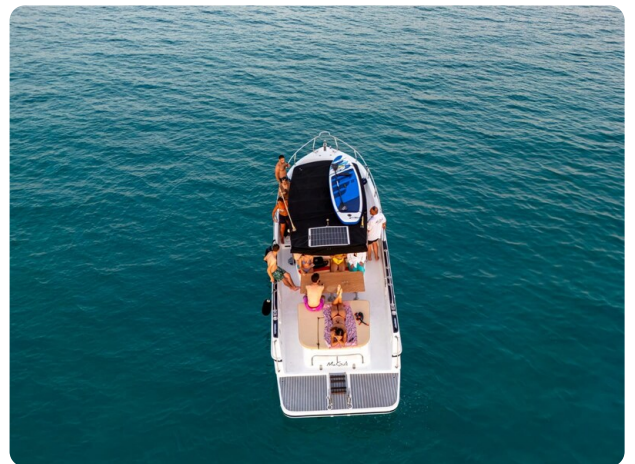
Canamer 33 aerial view