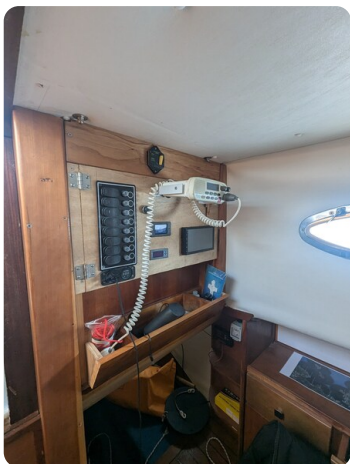
Canamer 33 detail