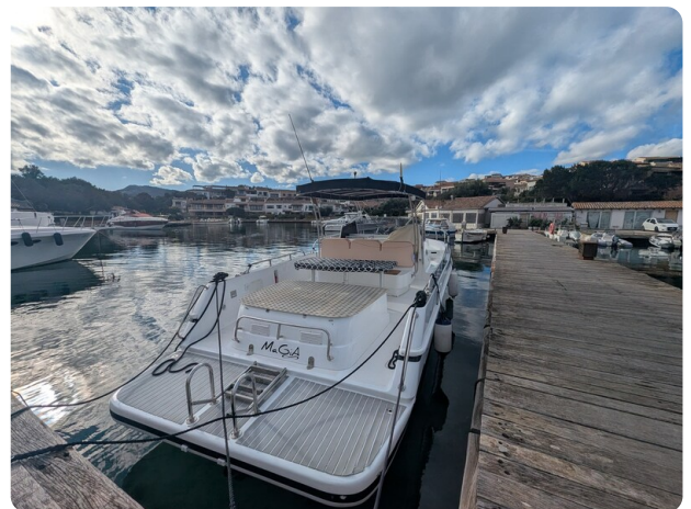
Canamer 33 aft view