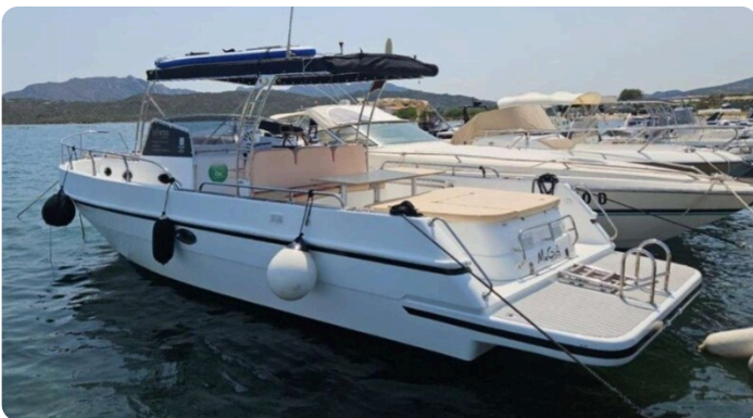
Canamer 33 aft profile