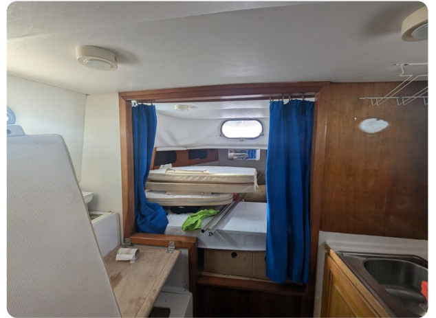
Canamer 33 cabin