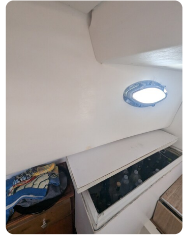
Canamer 33 details 2