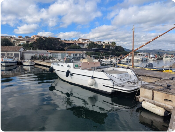
Canamer 33 aft profile