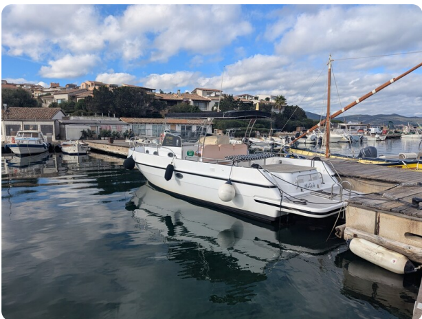
Canamer 33 view