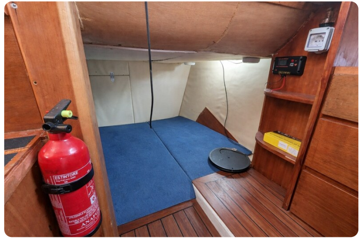
Canamer 33 aft cabin