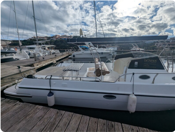
Canamer 33 side detail