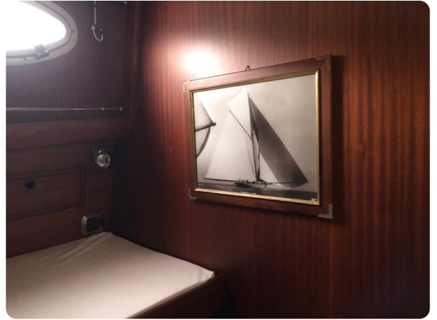
Guest cabin detail