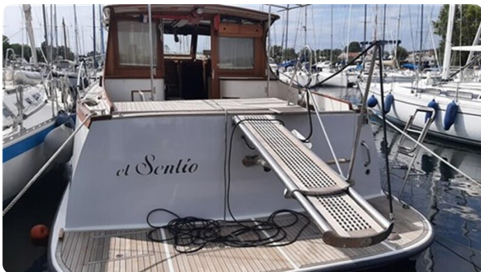
El Sentio stern view