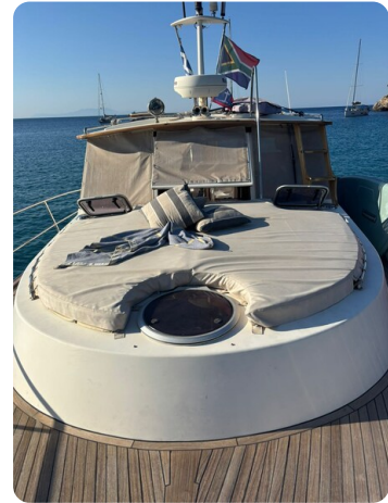
Foredeck sunbed 1