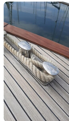
Bow cleat detail