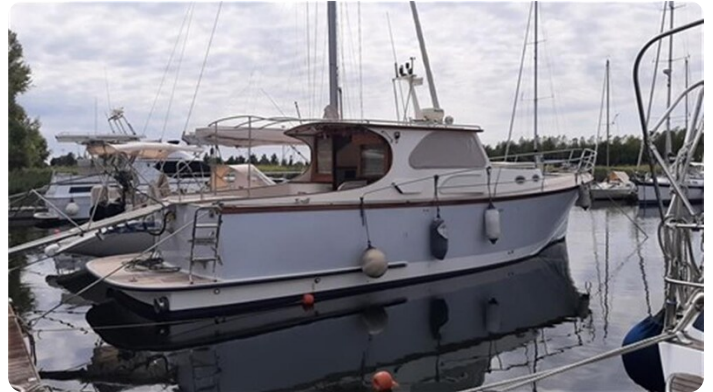
El Sentio aft quarter view