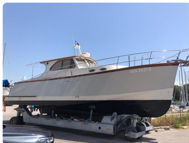
El Sentio side view