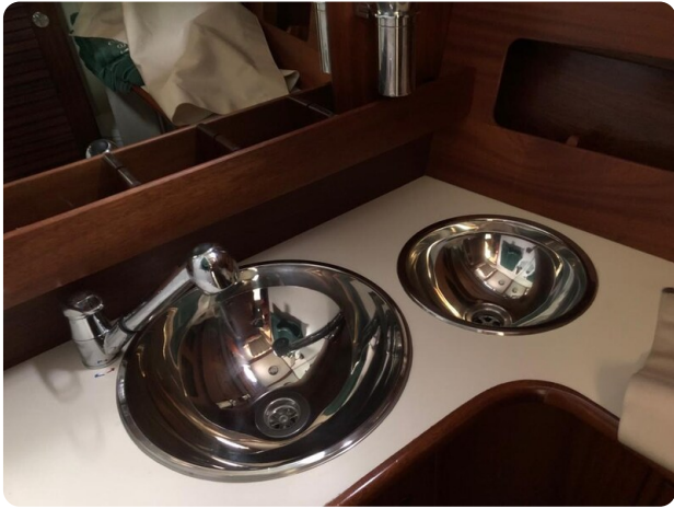
Guest cabin vanity 2