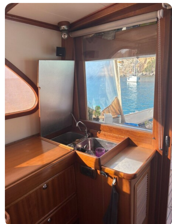
Galley sink inside 2.JPG