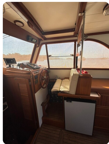
Helm station 1