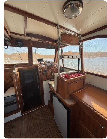
Helm station 4