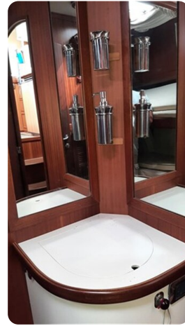
Guest cabin vanity