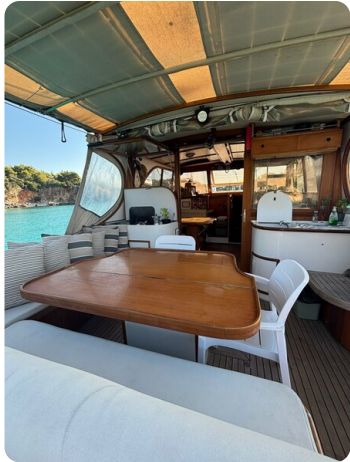
Cockpit dining area 2