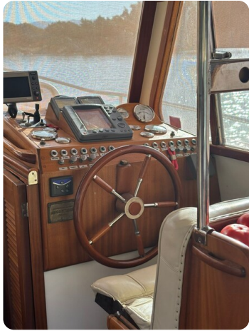
Helm station 3