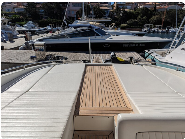
Cantieri di Sarnico 68 poppa