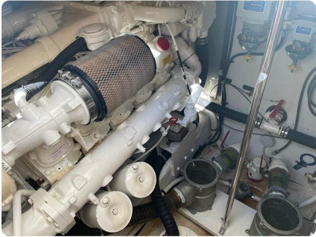
Cantieri di Sarnico 68 engine room