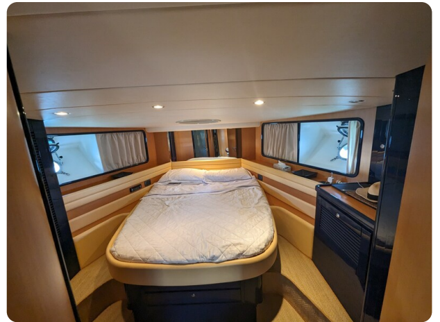
Cantieri di Sarnico 68 mastercabin