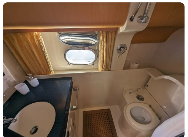
Cantieri di Sarnico 68 wc2