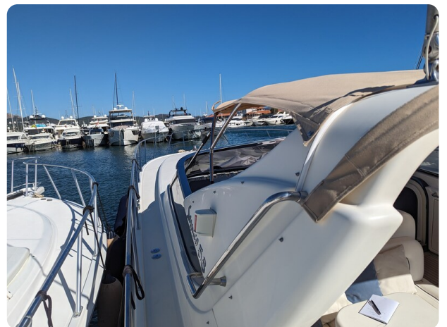
Cantieri di Sarnico 68 later view