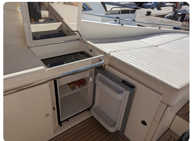
Cantieri di Sarnico 68