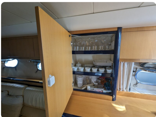
Cantieri di Sarnico 68 detail