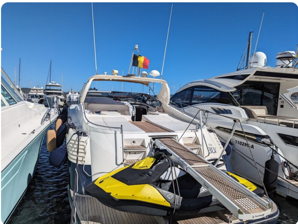
Cantieri di Sarnico 68