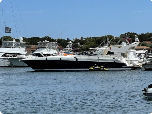
Cantieri di Sarnico 68 profile