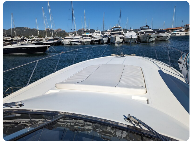
Cantieri di Sarnico 68 sunpad