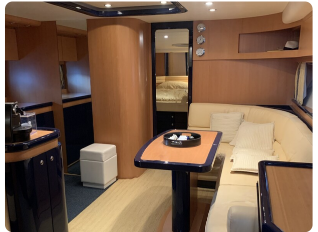
Cantieri di Sarnico 68 interior