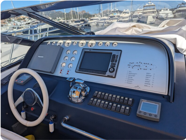
Cantieri di Sarnico 68