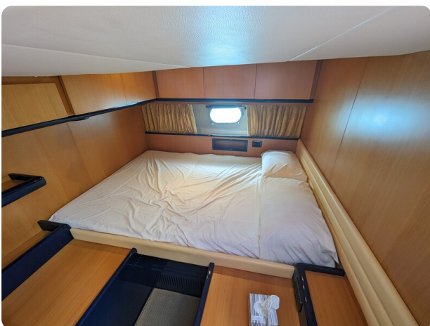
Cantieri di Sarnico 68 vip cabin