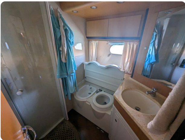
Cantieri di Sarnico 68 wc