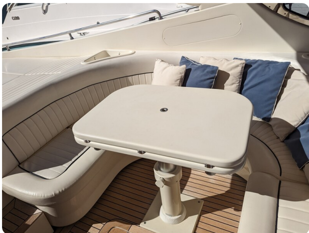
Sarnico 58 cockpit dinette