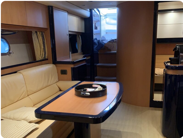
Cantieri di Sarnico 68 dinette