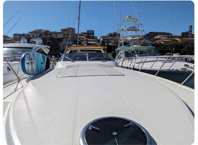
Cantieri di Sarnico 68 exterior