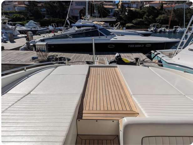
Sarnico 58 aft sunpad