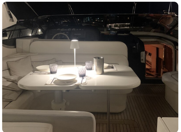
Sarnico 58 night view