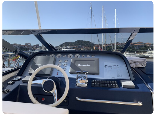
Cantieri di Sarnico 68 plancia