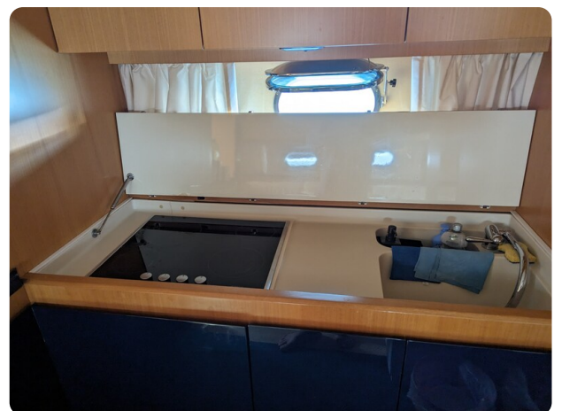
Cantieri di Sarnico 68 galley