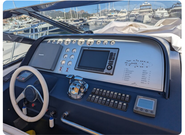
Sarnico 58 helm station