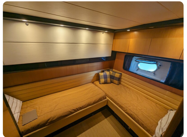
Cantieri di Sarnico 68 double cabin