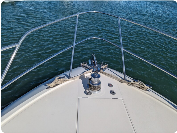
Cantieri di Sarnico 68 bow