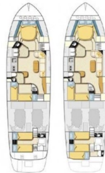
Cantieri di Sarnico 58 layout