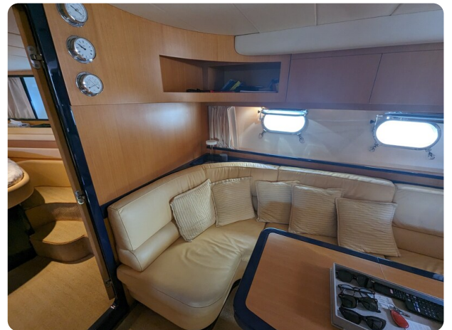
Cantieri di Sarnico 68 interior