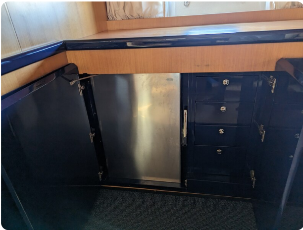
Cantieri di Sarnico 68 storage