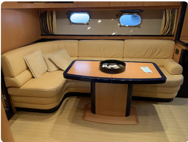
Cantieri di Sarnico 68 salon