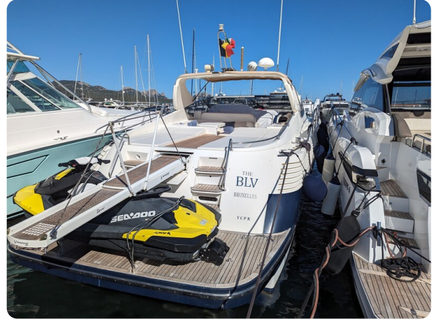
Cantieri di Sarnico 68 poppa