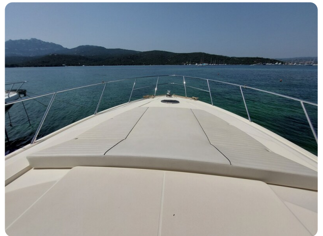
Sarnico 60 RiAl bow