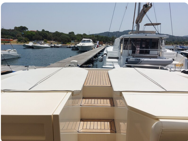
Sarnico 60 RiAl pics 122952