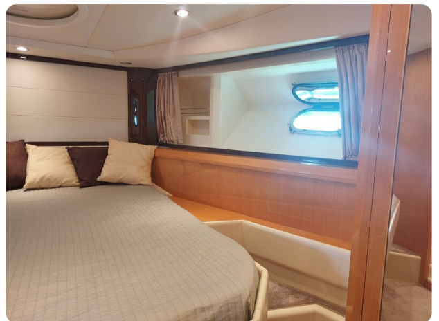
Sarnico 60 RiAl pics 141636