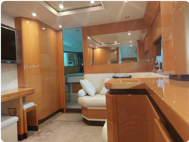
Sarnico 60 RiAl pics 142029