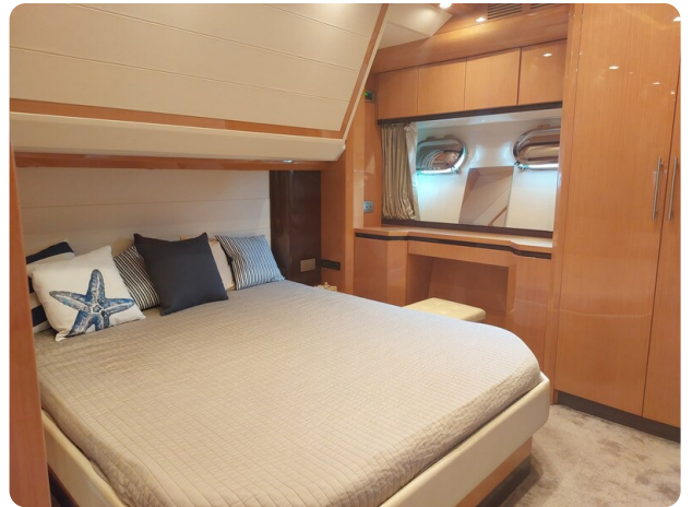
Sarnico 60 RiAl master cabin