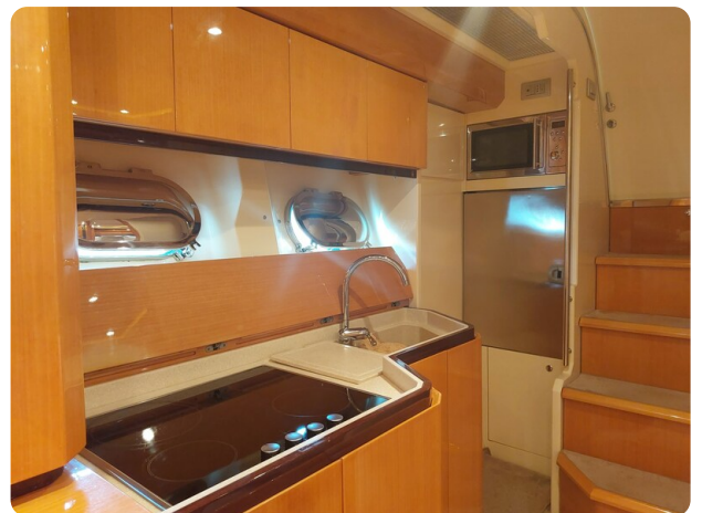
Sarnico 60 RiAl interior galley