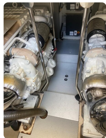
Sarnico 60 engine