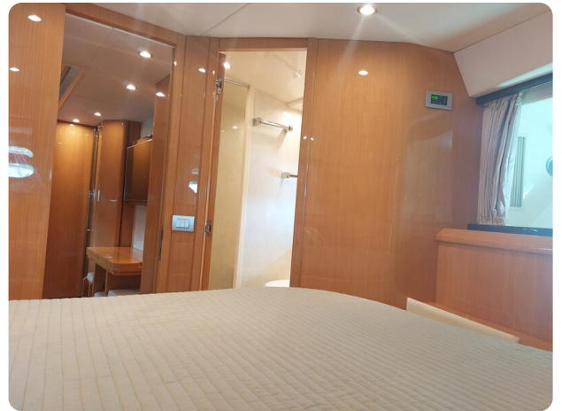
Sarnico 60 RiAl pics 141710