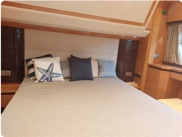
Sarnico 60 RiAl pics 141905