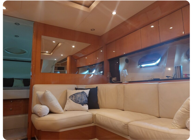
Sarnico 60 RiAl interior salon (1)