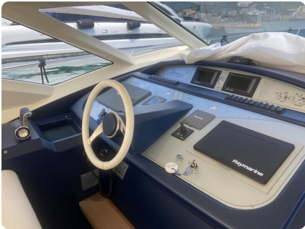
Sarnico 60 plancia