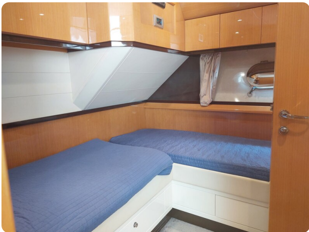
Sarnico 60 RiAl double cabin