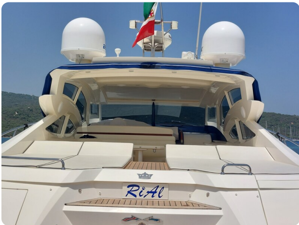
Sarnico 60 RiAl aft sunpad