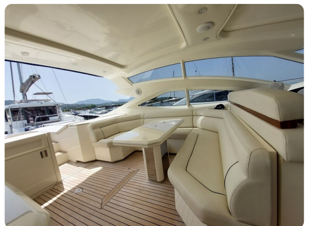
Sarnico 60 RiAl exterior dinette