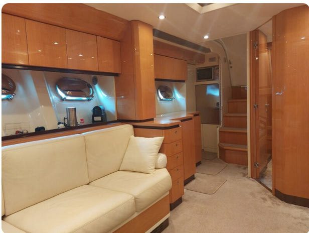
Sarnico 60 RiAl dinette and galley