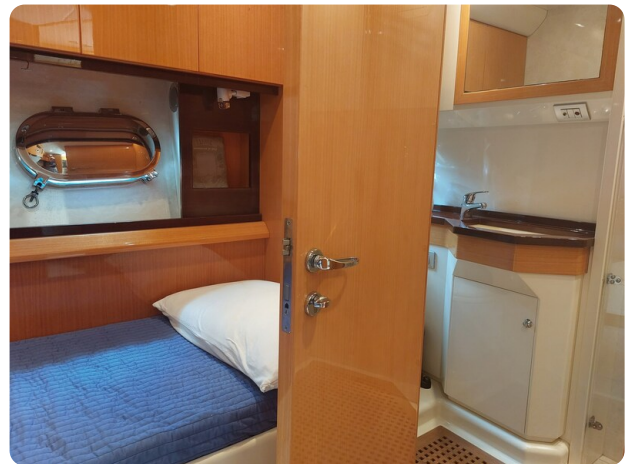
Sarnico 60 RiAl double cabin and wc