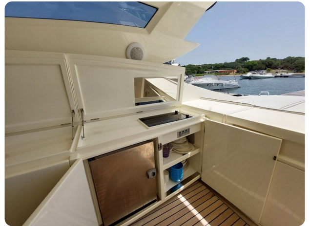
Sarnico 60 RiAl pics 123202