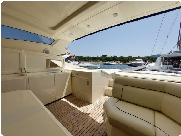
Sarnico 60 RiAl pics 123141