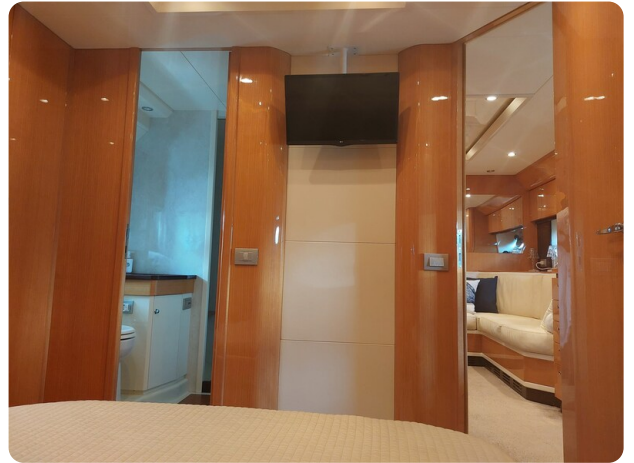
Sarnico 60 RiAl master cabin and toilette