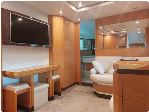
Sarnico 60 RiAl interior salon