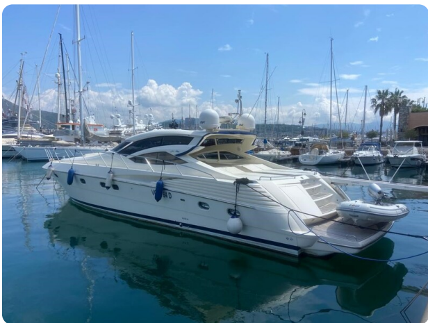
Sarnico 60 profile