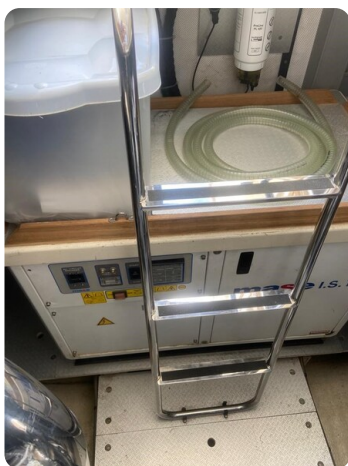
Sarnico 60, engine room