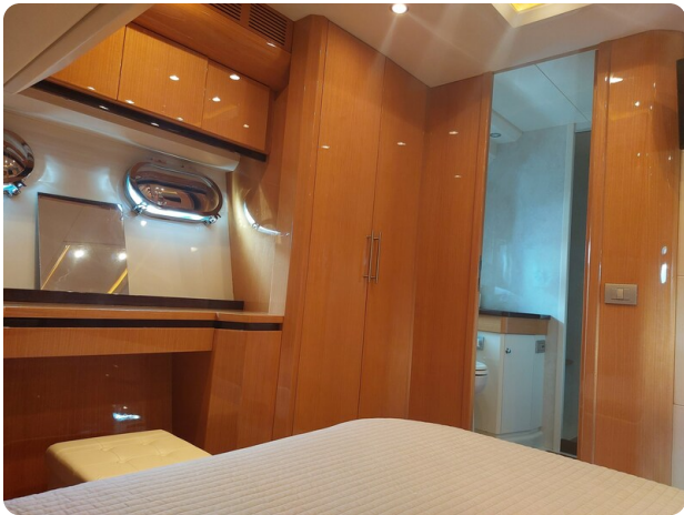
Sarnico 60 RiAl pics 141919