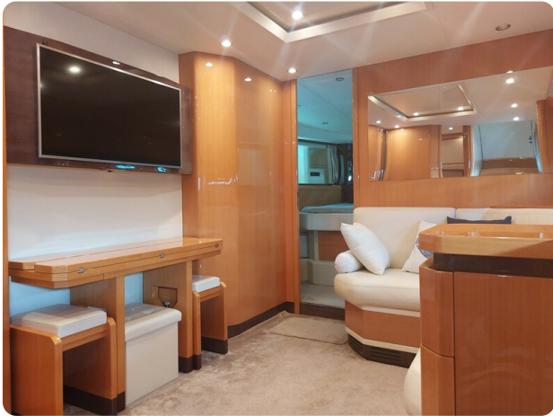
Sarnico 60 RiAl interior salon