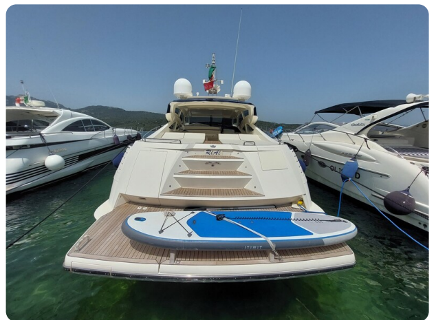
Sarnico 60 RiAl aft view