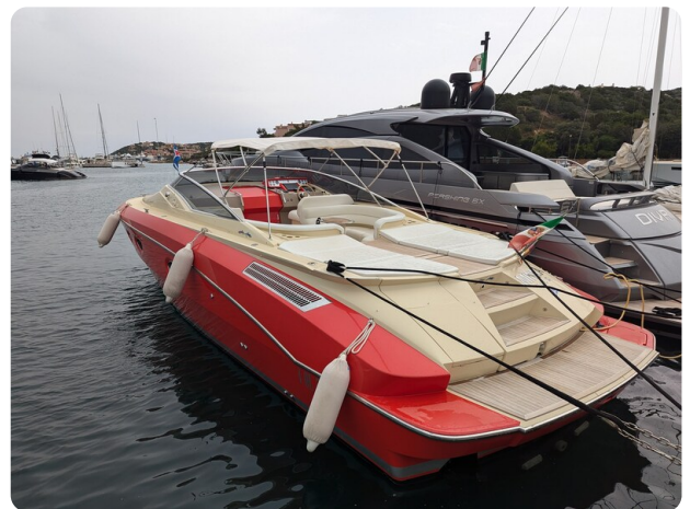
Sarnico Spider aft profile