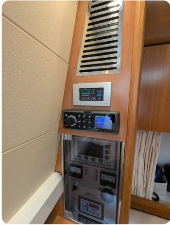
Sarnico Spider salon detail