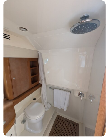
Sarnico Spider shower