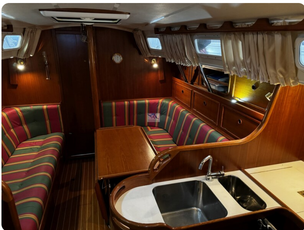
Contest 35S 17