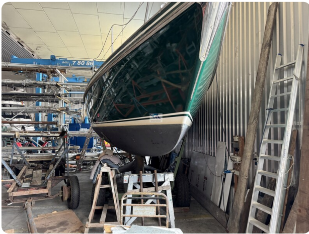
Contest 35S 38