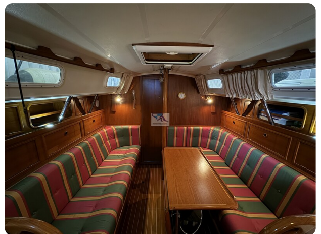
Contest 35S 20