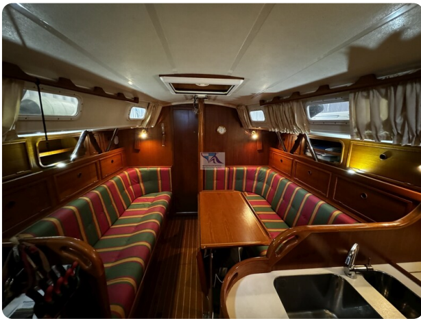
Contest 35S 14