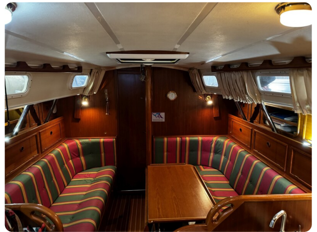
Contest 35S 16