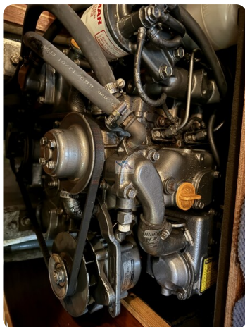
Contest 35S 29