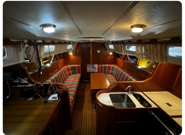
Contest 35S 13