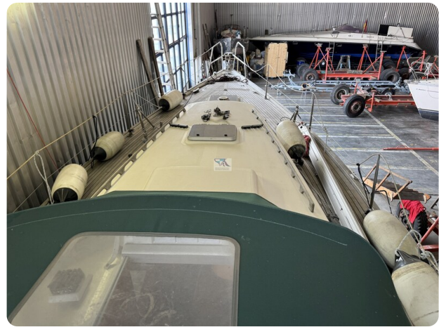
Contest 35S 31