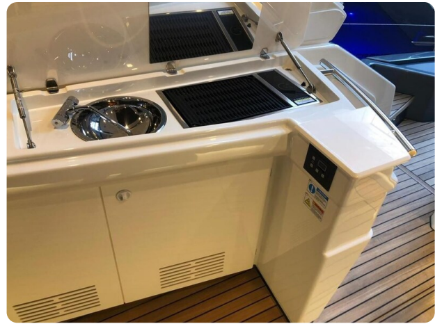
Cranchi 60 ST Main Deck Galley.jpg