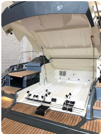
Cranchi 60 ST Garage.jpg