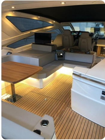
Cranchi 60 ST Cockpit.jpg