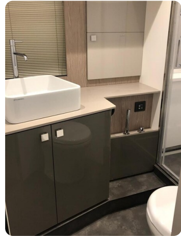
Cranchi 60 ST Bathroom.jpg