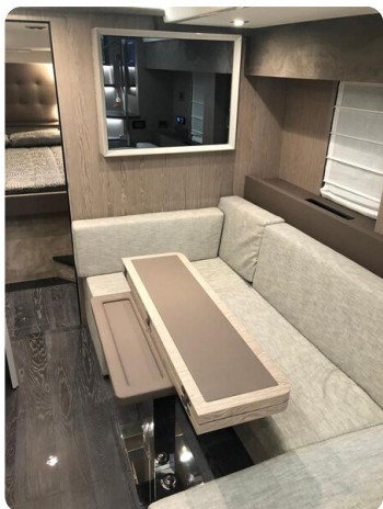
Cranchi 60 ST Lower Deck Dinette.jpg