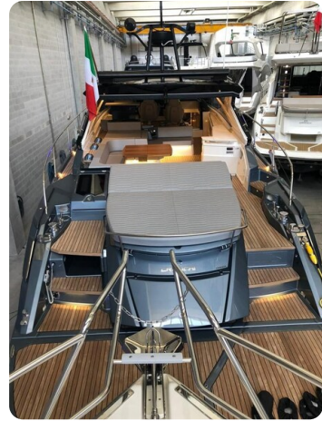
Cranchi 60 ST Aft Sunpad.jpg