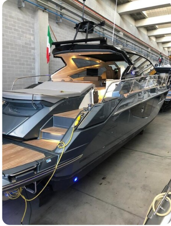
Cranchi 60 ST Aft Profile.jpg