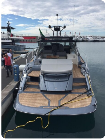
Cranchi 60 ST Stern View.jpg