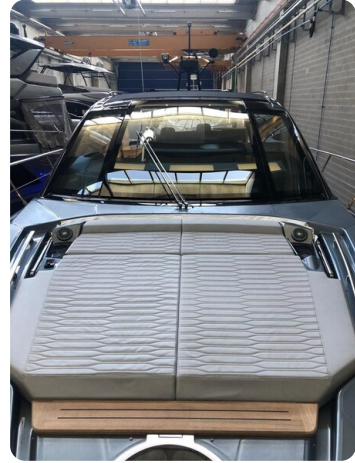
Cranchi 60 ST Fore Sunpad.jpg