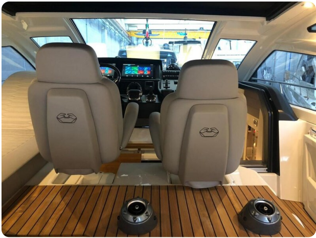
Cranchi 60 ST Helm Station.jpg