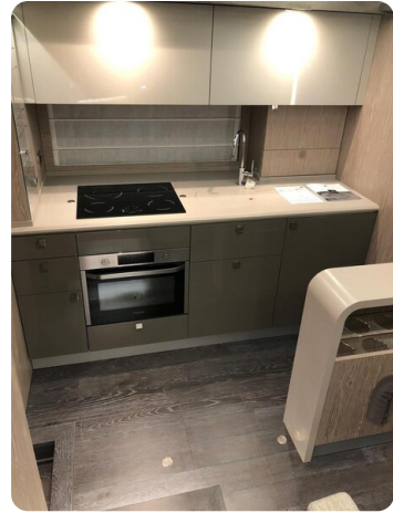
Cranchi 60 ST Lower Deck Galley.jpg