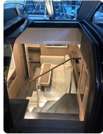
Cranchi 60 ST Dinette Top View.jpg