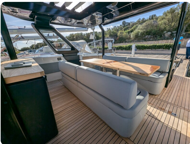
Cranchi 46 Luxury Tender cockpit dinette