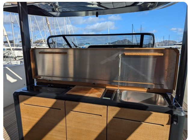
Cranchi 46 Luxury Tender galley