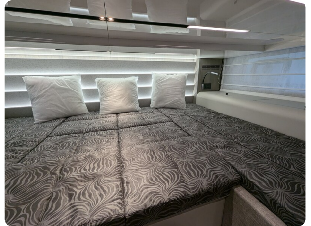
Cranchi 46 Luxury Tender master cabin detail