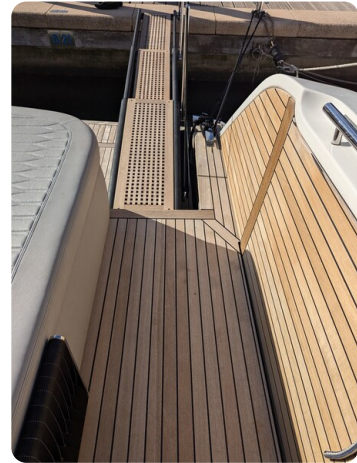
Cranchi 46 Luxury Tender gangway