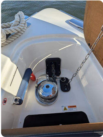
Cranchi 46 Luxury Tender bow windlass