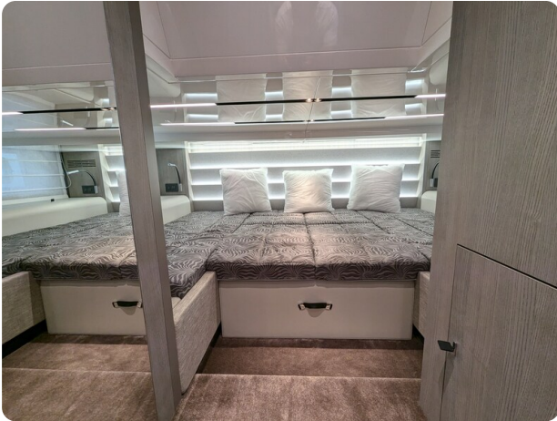
Cranchi 46 Luxury Tender master cabin