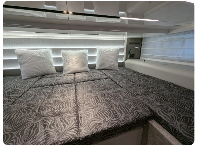
Cranchi 46 Luxury Tender master cabin detail