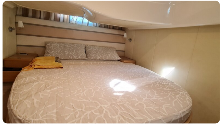
Cranchi 43 Méditerranée Vip