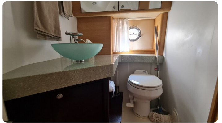
Cranchi 43 Méditerranée, bathroom view.jpg