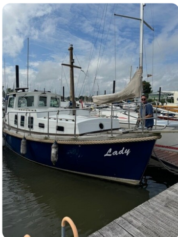
Spitzgatt Kutter Lady