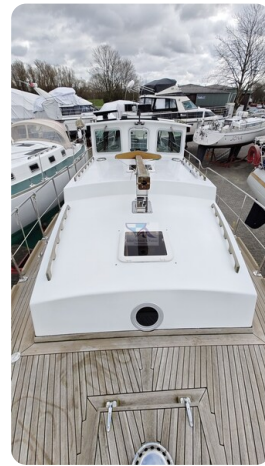
Spitzgatt Kutter LADY 18