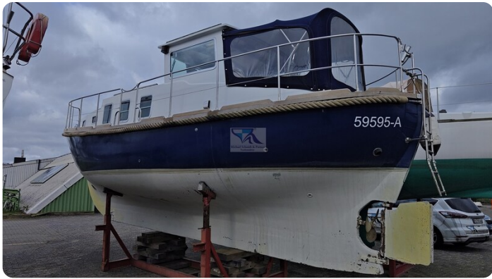
Spitzgatt Kutter LADY 2