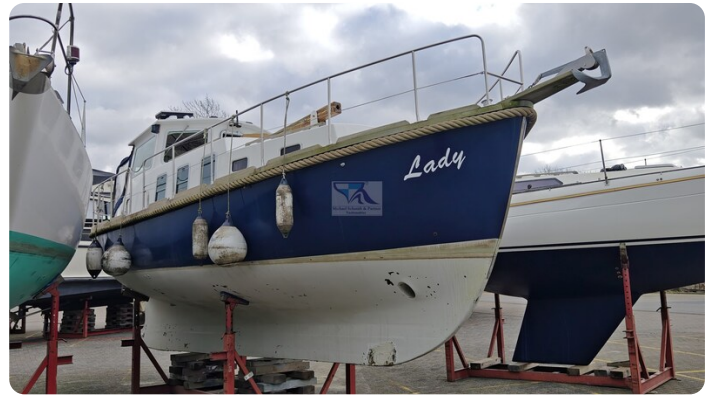
Spitzgatt Kutter LADY 7