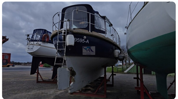
Spitzgatt Kutter LADY 1