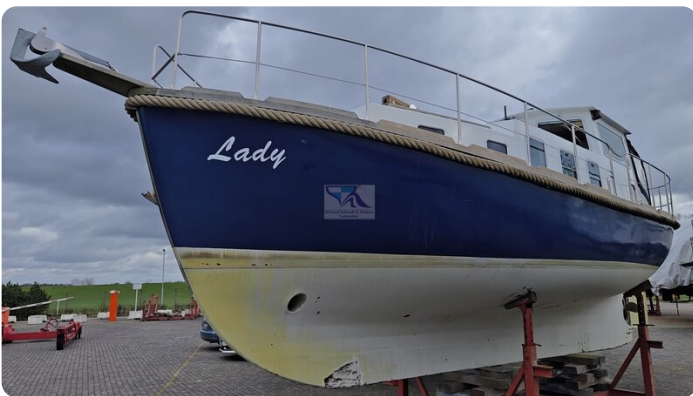
Spitzgatt Kutter LADY 6