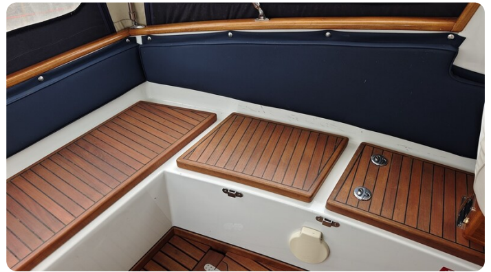
Spitzgatt Kutter LADY 12