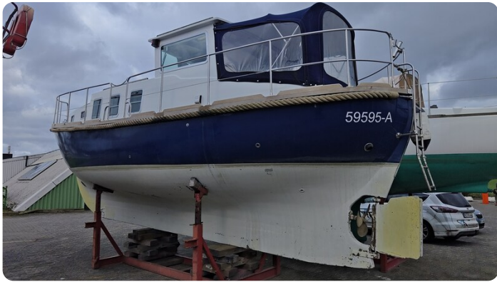
Spitzgatt Kutter LADY