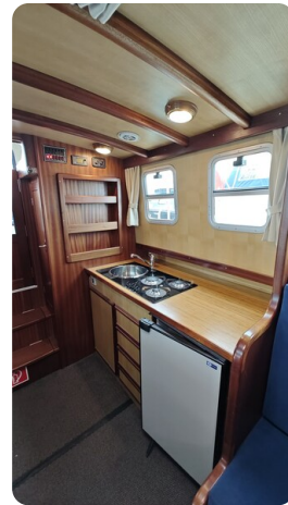
Spitzgatt Kutter LADY 16