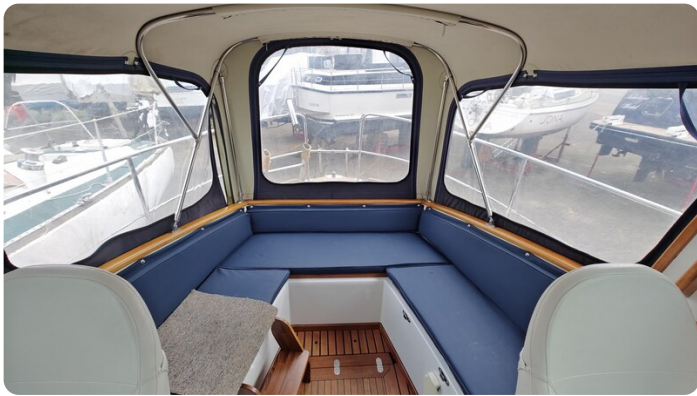
Spitzgatt Kutter LADY 10