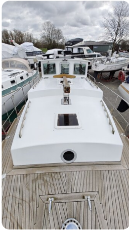
Spitzgatt Kutter LADY 6