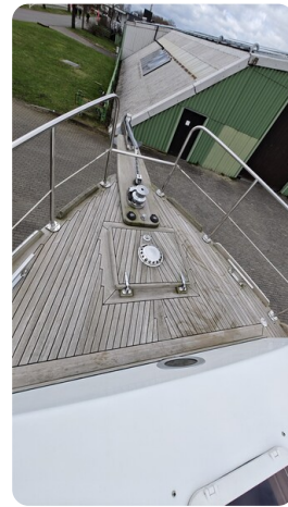
Spitzgatt Kutter LADY 5