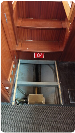
Spitzgatt Kutter LADY 21