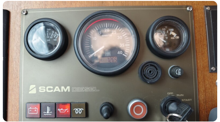
Spitzgatt Kutter LADY 22