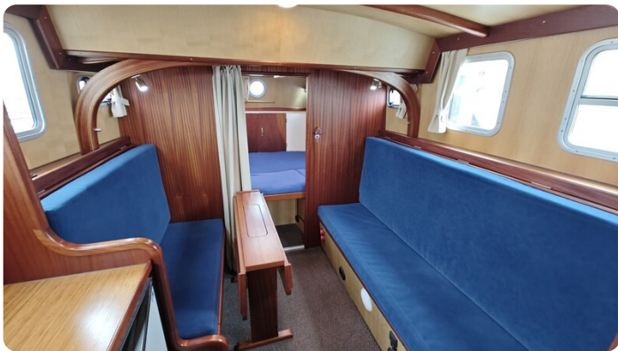
Spitzgatt Kutter LADY 13