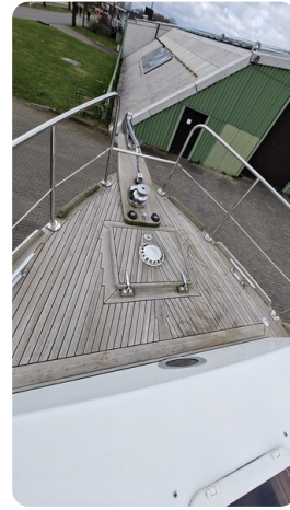
Spitzgatt Kutter LADY 5