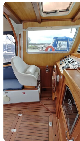
Spitzgatt Kutter LADY 9