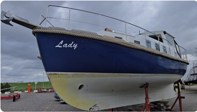
Spitzgatt Kutter LADY 1