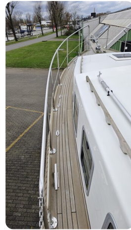
Spitzgatt Kutter LADY 4