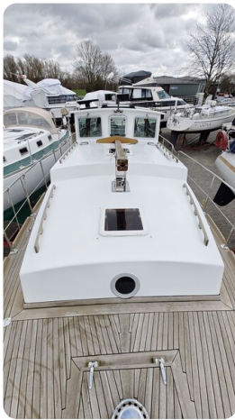
Spitzgatt Kutter LADY 6