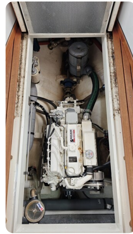
Spitzgatt Kutter LADY 11