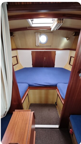
Spitzgatt Kutter LADY 19