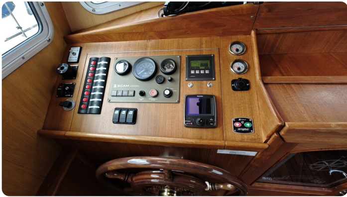
Spitzgatt Kutter LADY 8