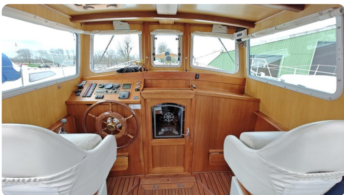
Spitzgatt Kutter LADY 7