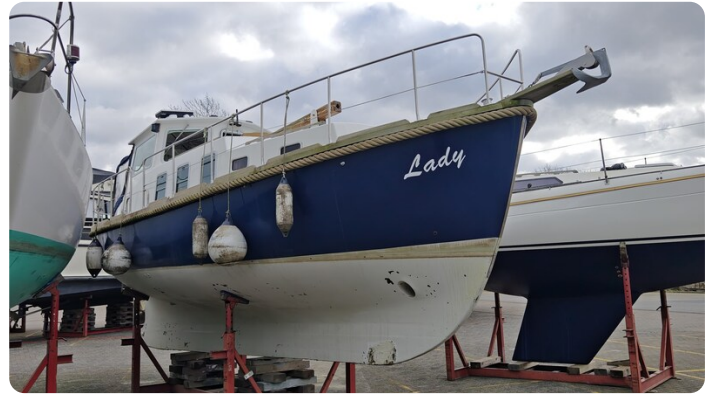
Spitzgatt Kutter LADY 2