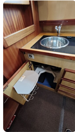
Spitzgatt Kutter LADY 18