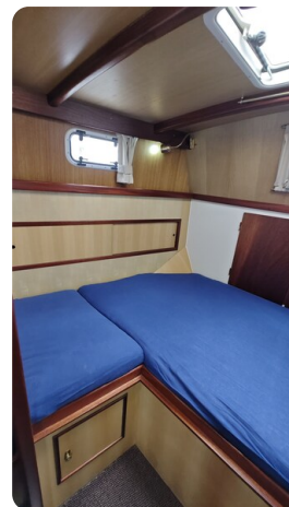
Spitzgatt Kutter LADY 20