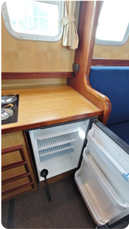
Spitzgatt Kutter LADY 17