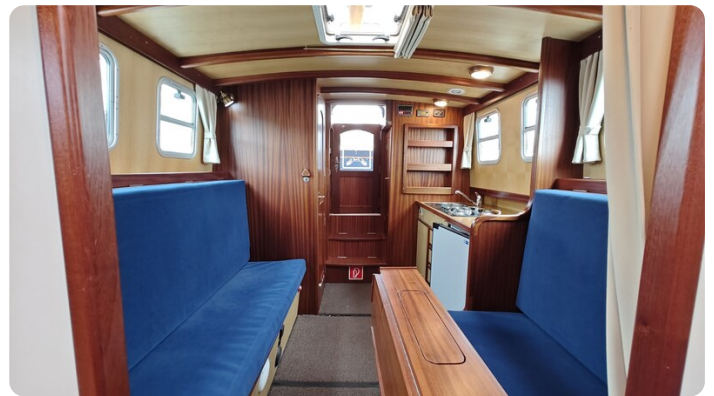
Spitzgatt Kutter LADY 14