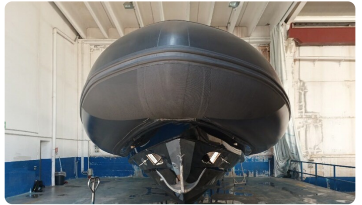
Dariel DTS Bow