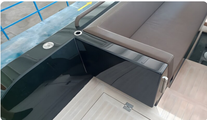
Dariel DTS Sofa Detail