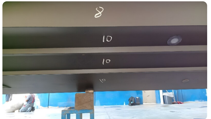
Dariel DTS Hull Detail