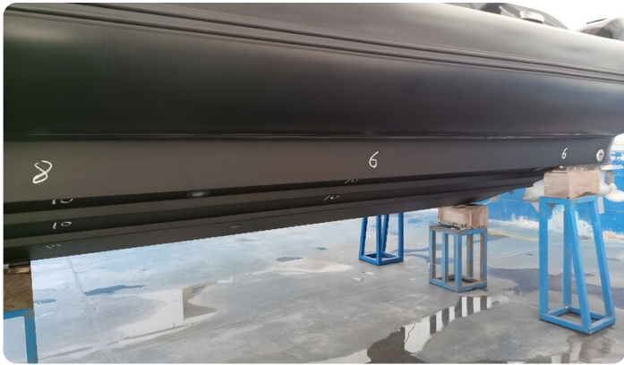
Dariel DTS Port Hull