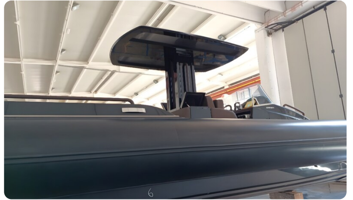
Dariel DTS T-top Detail