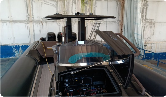
Dariel DTS T-top