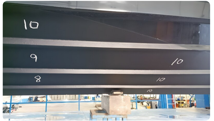
Dariel DTS Hull