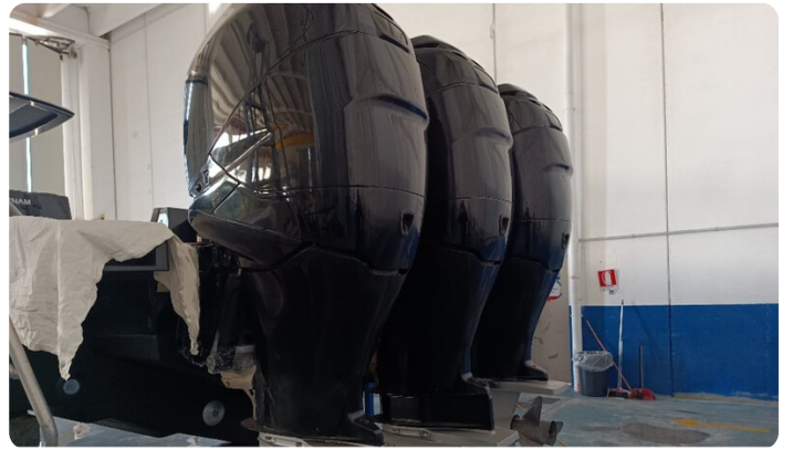
Dariel DTS Engines Detail