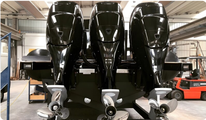
Dariel DTS Engines