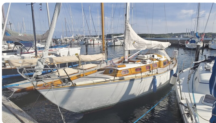
6 KR De Dood 4