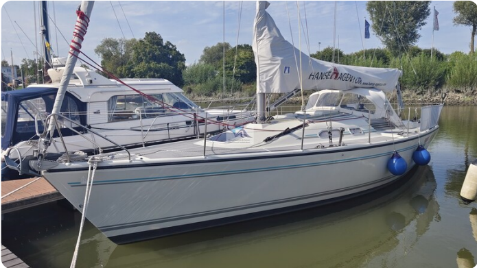
Dehler 36 mr_msp788732_4