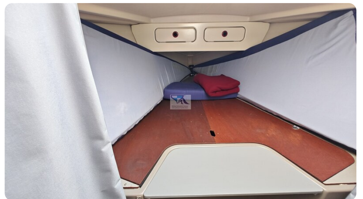
Dehler 36 mr_msp788732_39