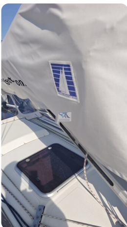
Dehler 36 mr_msp788732_15