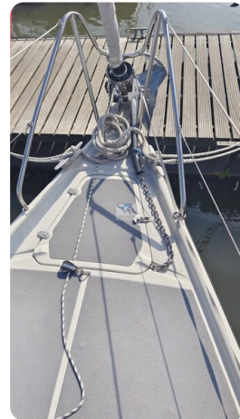
Dehler 36 mr_msp788732_8