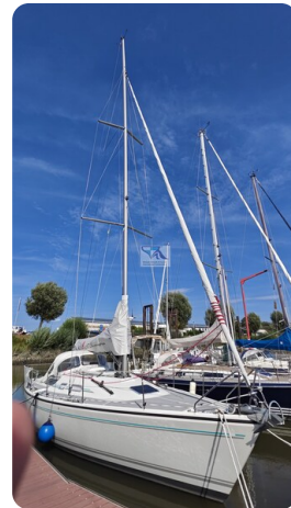
Dehler 36 mr_msp788732_2