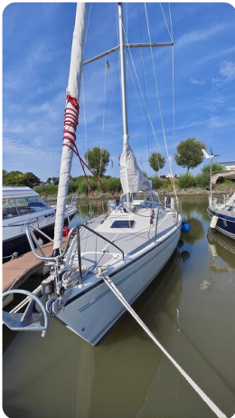
Dehler 36 mr_msp788732_5