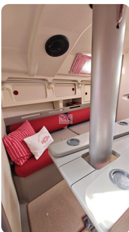
Dehler 36 mr_msp788732_44