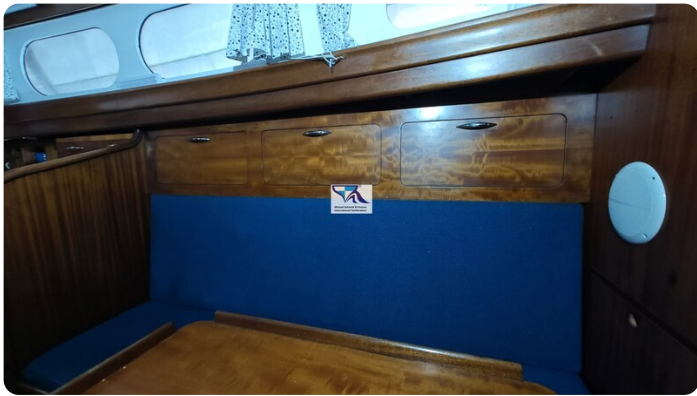
Marken II_msp797539 95