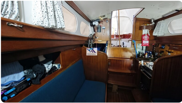
Marken II_msp797539 91