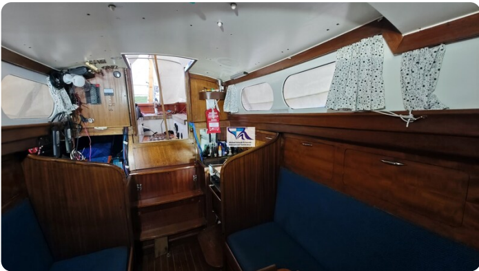
Marken II_msp797539 89