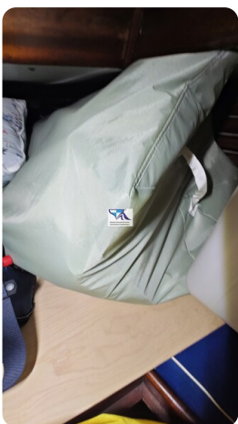
Marken II_msp797539 111