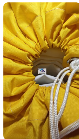
Marken II_msp797539 110