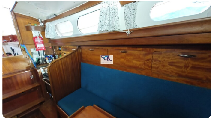
Marken II_msp797539 90