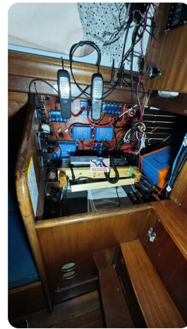
Marken II_msp797539 98