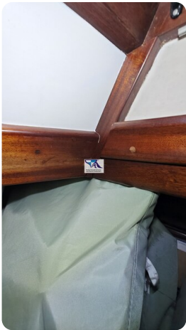
Marken II_msp797539 115