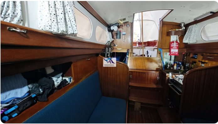
Marken II_msp797539 91