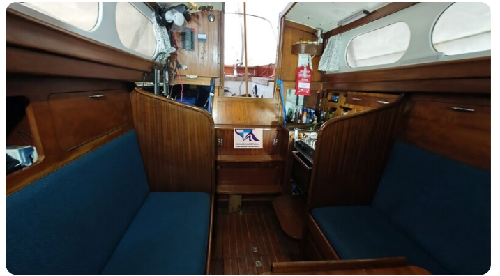
Marken II_msp797539 92