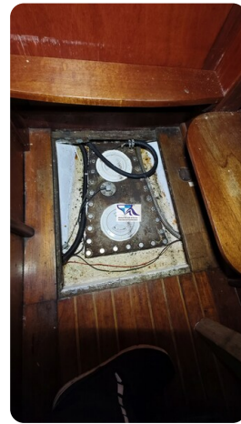
Marken II_msp797539 97