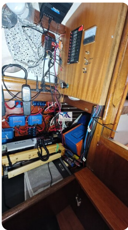
Marken II_msp797539 99