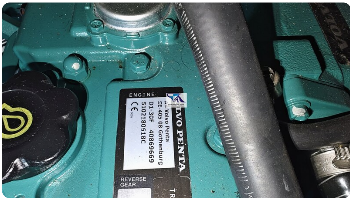
Marken II_msp797539 121