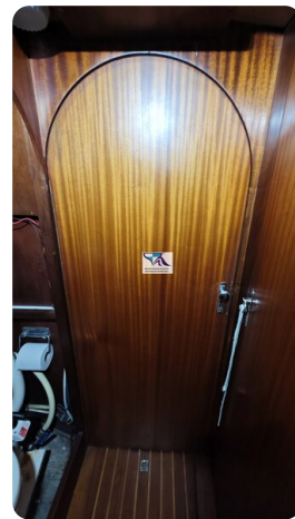
Marken II_msp797539 108