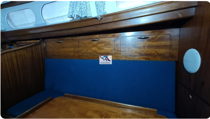
Marken II_msp797539 95