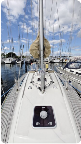
Dufour 365 Grand Large msp499823 51