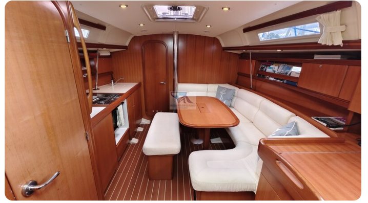
Dufour 365 Grand Large msp499823 1