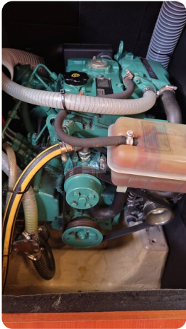
Dufour 365 Grand Large msp499823 31