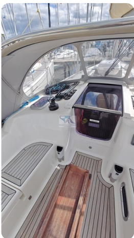
Dufour 365 Grand Large msp499823 40