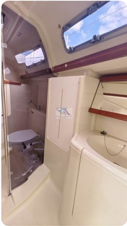
Dufour 365 Grand Large msp499823 20