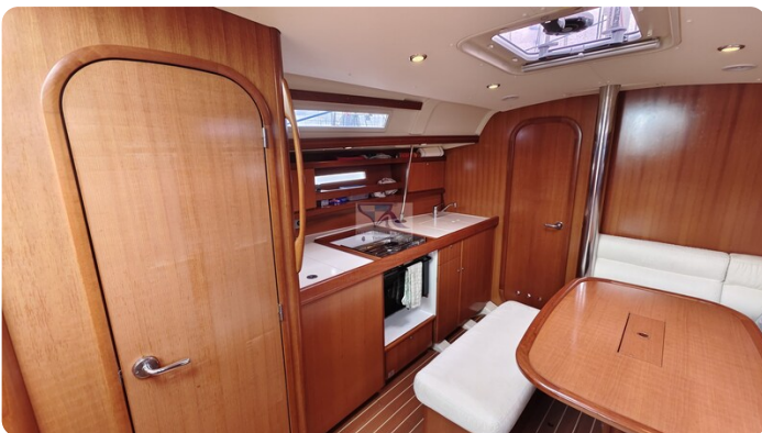
Dufour 365 Grand Large msp499823 6