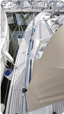
Dufour 365 Grand Large msp499823 46