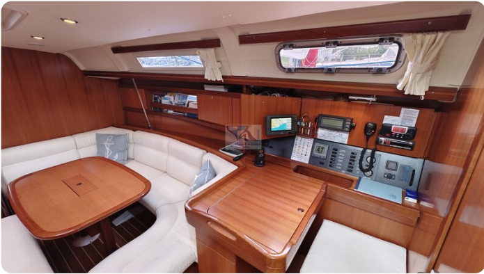
Dufour 365 Grand Large msp499823 2