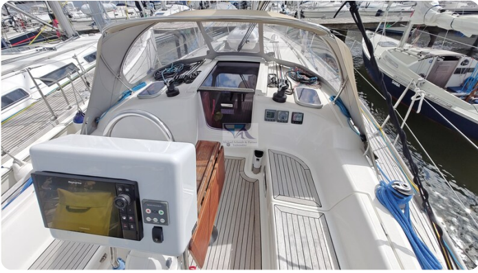
Dufour 365 Grand Large msp499823 38