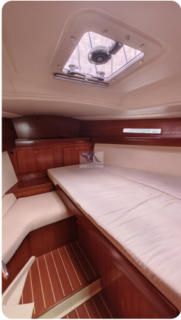
Dufour 365 Grand Large msp499823 26