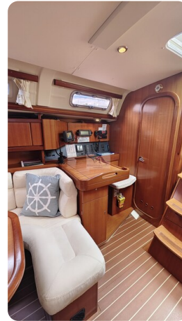
Dufour 365 Grand Large msp499823 4