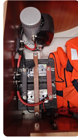
Dufour 365 Grand Large msp499823 35