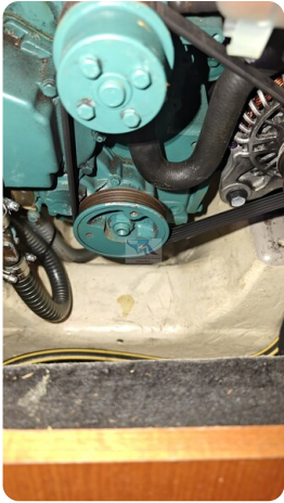
Dufour 365 Grand Large msp499823 34