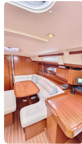
Dufour 365 Grand Large msp499823 3