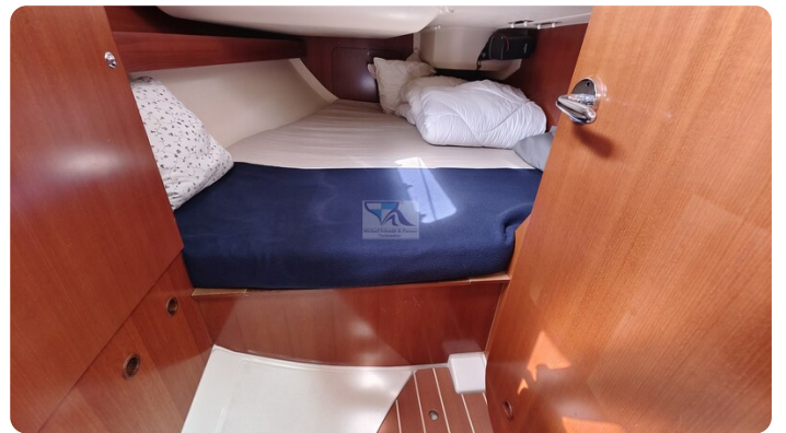
Dufour 365 Grand Large msp499823 22