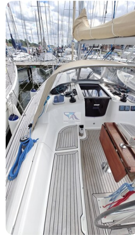
Dufour 365 Grand Large msp499823 36