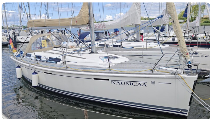
Dufour 365 Grand Large msp499823 54