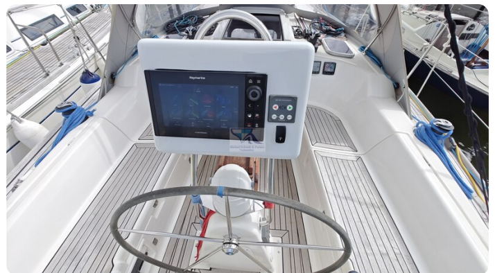
Dufour 365 Grand Large msp499823 41