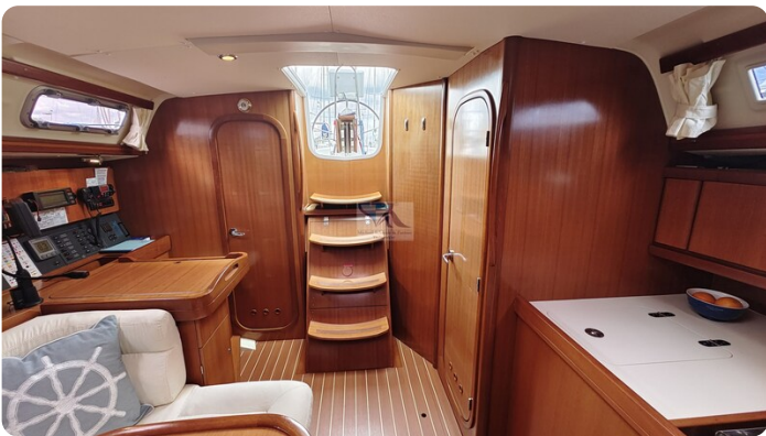
Dufour 365 Grand Large msp499823 11