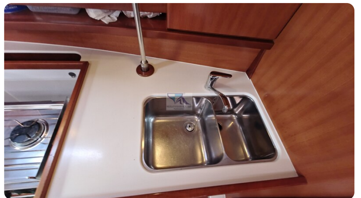
Dufour 365 Grand Large msp499823 10