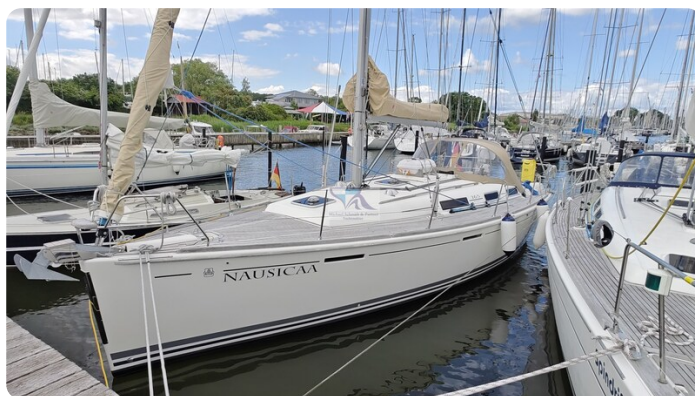
Dufour 365 Grand Large msp499823 56