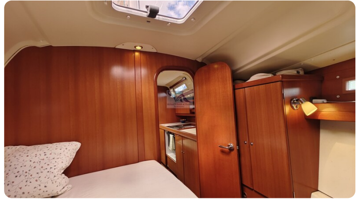
Dufour 365 Grand Large msp499823 29