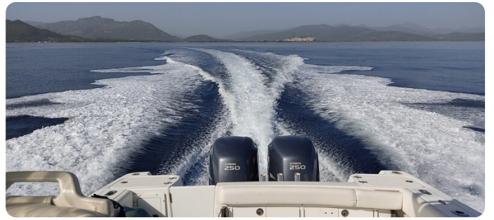
Edge Water 265 ex-9