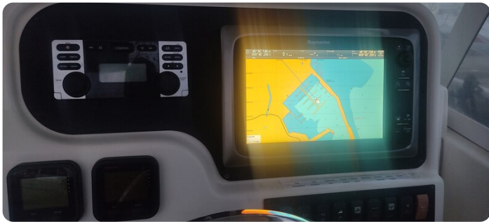
Edge Water 265 ex-14