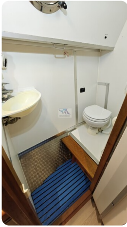
Reinke Tourina 10m_28