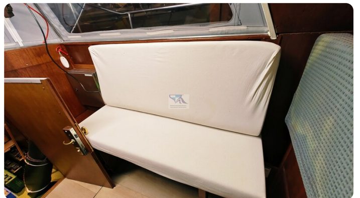
Reinke Tourina 10m_64