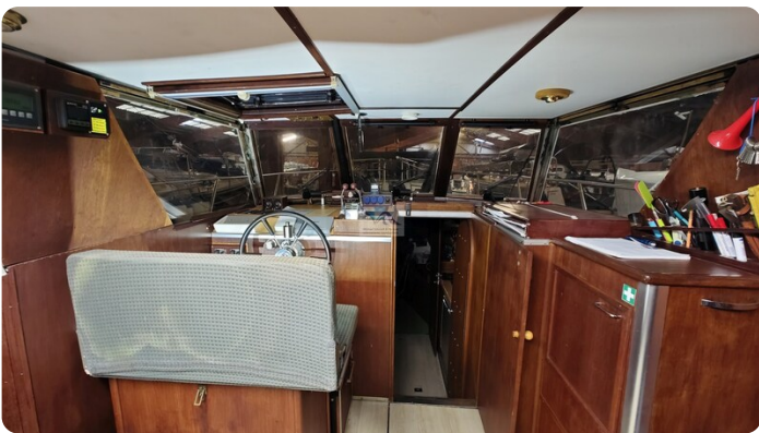
Reinke Tourina 10m_35