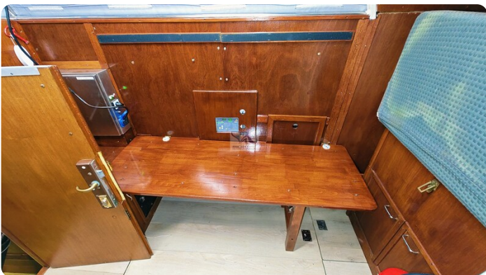
Reinke Tourina 10m_62