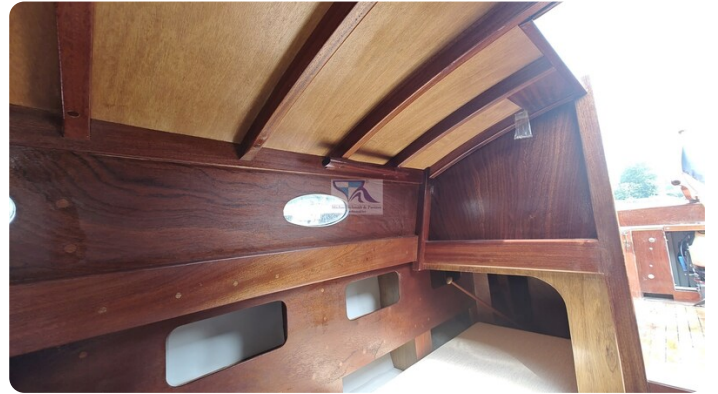
Mahagoni Kielschwerter 2024 28