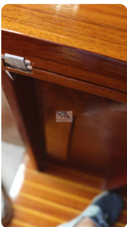
Mahagoni Kielschwerter 2024 31