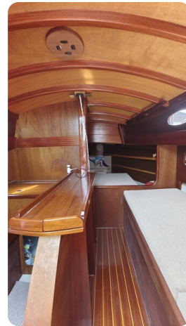
Mahagoni Kielschwerter 2024 21