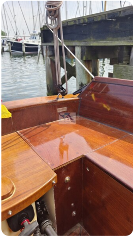
Mahagoni Kielschwerter 2024 10