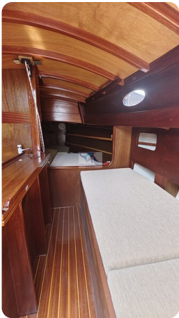
Mahagoni Kielschwerter 2024 20