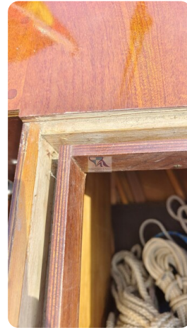
Mahagoni Kielschwerter 2024 15