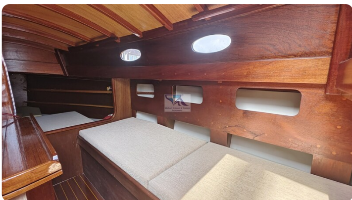
Mahagoni Kielschwerter 2024 18