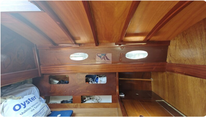
Mahagoni Kielschwerter 2024 26