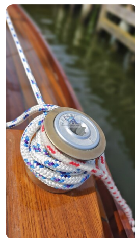
Mahagoni Kielschwerter 2024 32