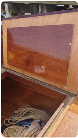
Mahagoni Kielschwerter 2024 16