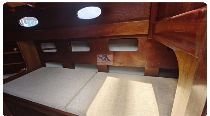
Mahagoni Kielschwerter 2024 19