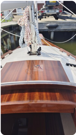
Mahagoni Kielschwerter 2024 5