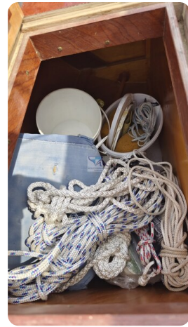
Mahagoni Kielschwerter 2024 17