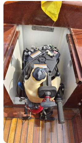
Mahagoni Kielschwerter 2024 8