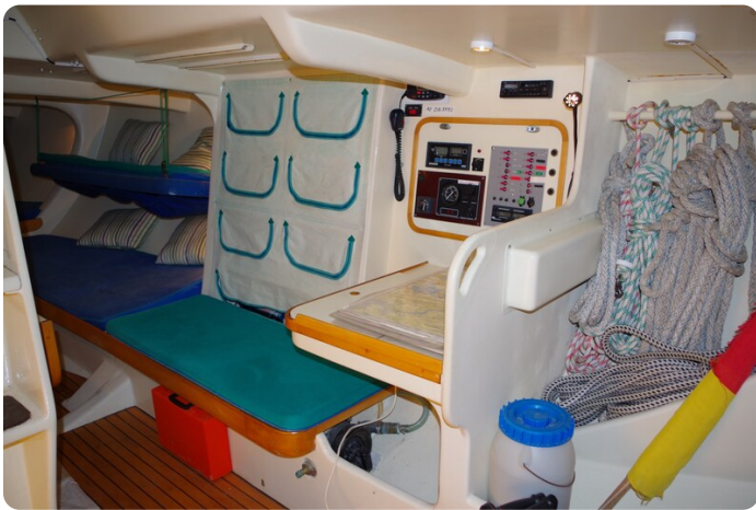
MSP_5276 - Kopie