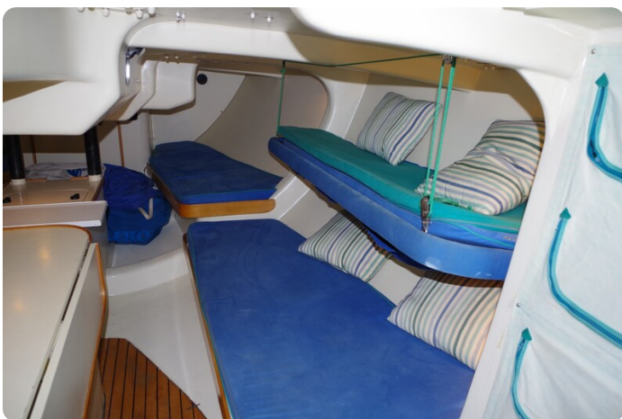
MSP_5271 - Kopie