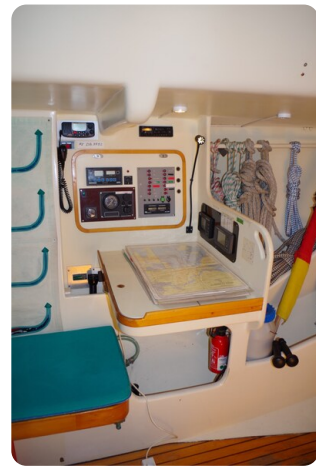
MSP_5277 - Kopie