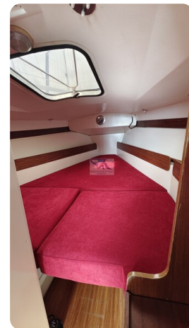
Etap 23i 1