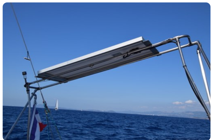
DSC_0283 - Copie