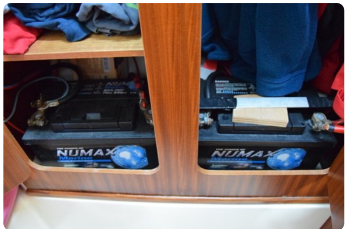
DSC_0294 - Copie