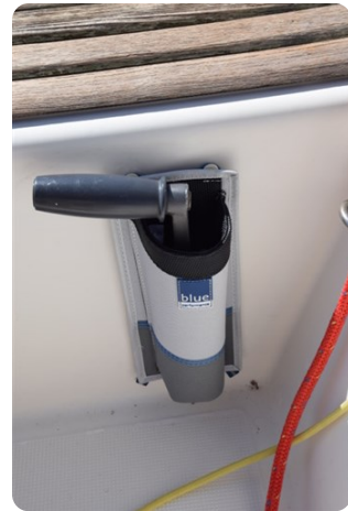
DSC_0270 - Copie