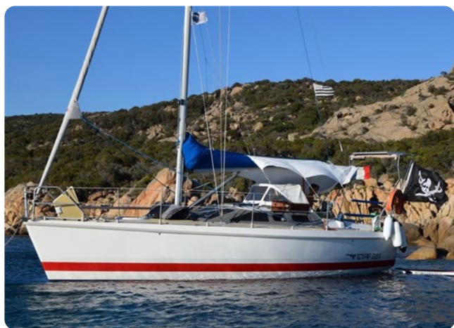
DSC_0069 - Copie