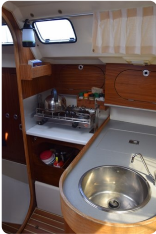
DSC_0291 - Copie