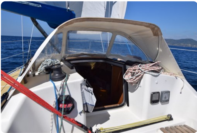
DSC_0267 - Copie