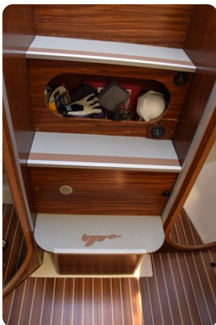
DSC_0287 - Copie