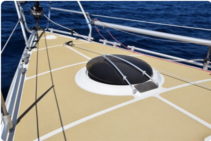
DSC_0274 - Copie