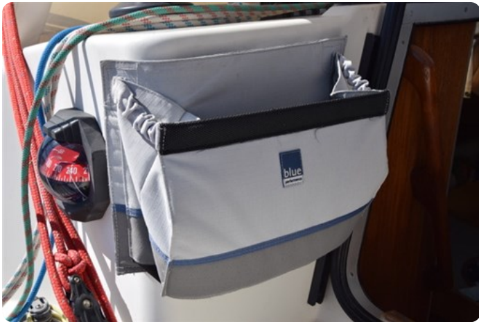
DSC_0269 - Copie