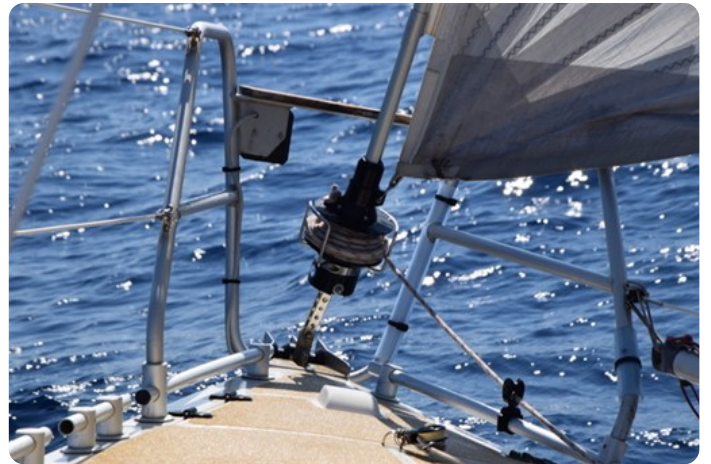
DSC_0279 - Copie