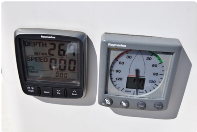
DSC_0268 - Copie