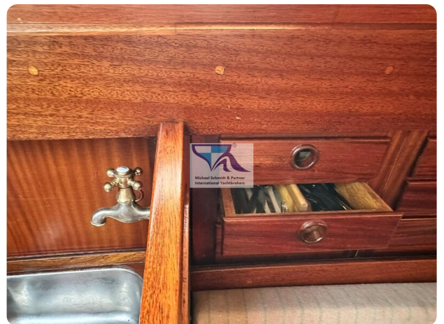
Skorpion I 45