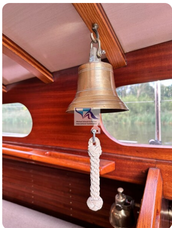
Skorpion I 43