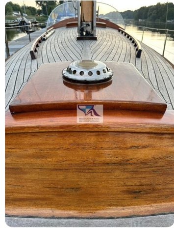
Skorpion I 6