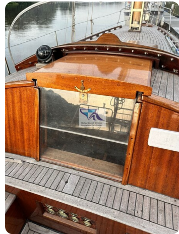
Skorpion I 27