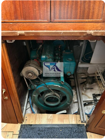
Skorpion I 53