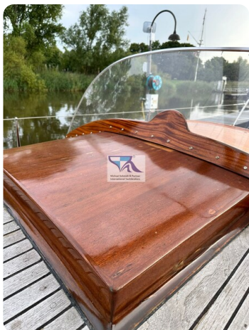
Skorpion I 13