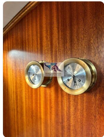
Skorpion I 55