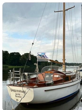
Skorpion I 1