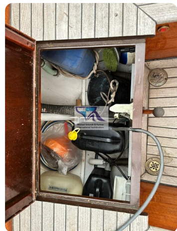
Skorpion I 61