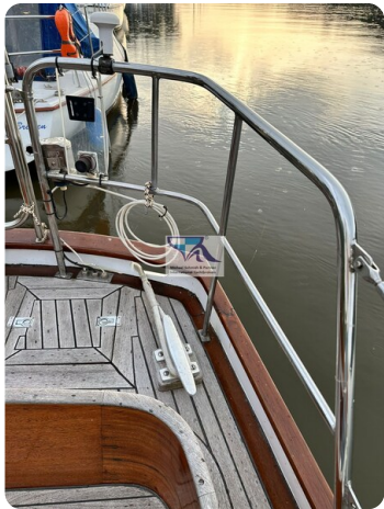
Skorpion I 18