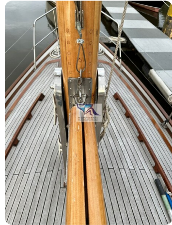
Skorpion I 12