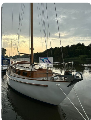
Skorpion I 2