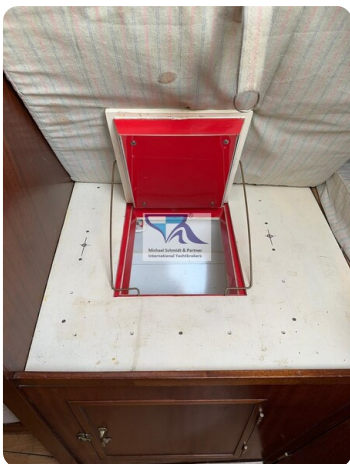
Skorpion I 56