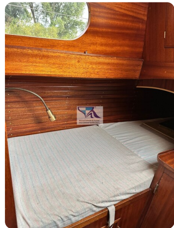
Skorpion I 35