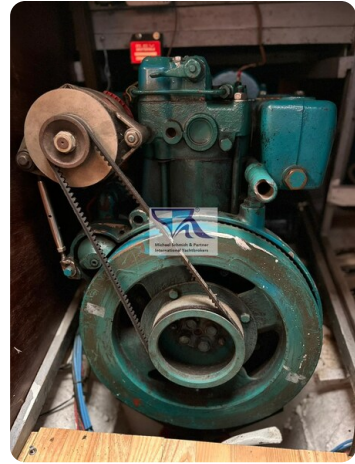
Skorpion I 50