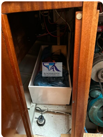
Skorpion I 54