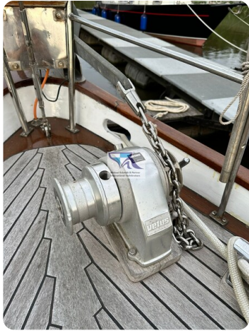
Skorpion I 5