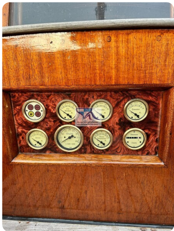
Skorpion I 22