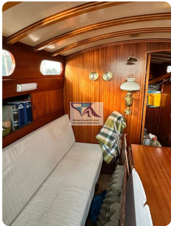
Skorpion I 49