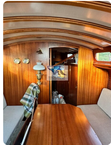
Skorpion I 51