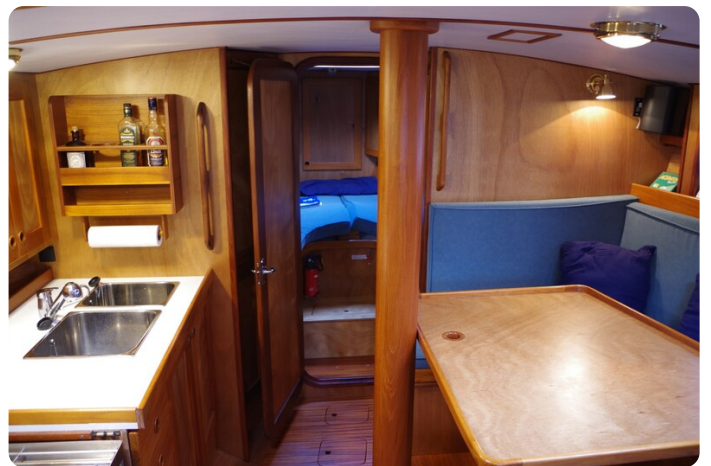
Skorpion II ESTRELLA 34