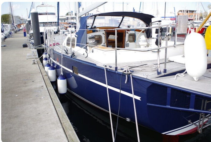
SKORPION II ESTRELLA 6