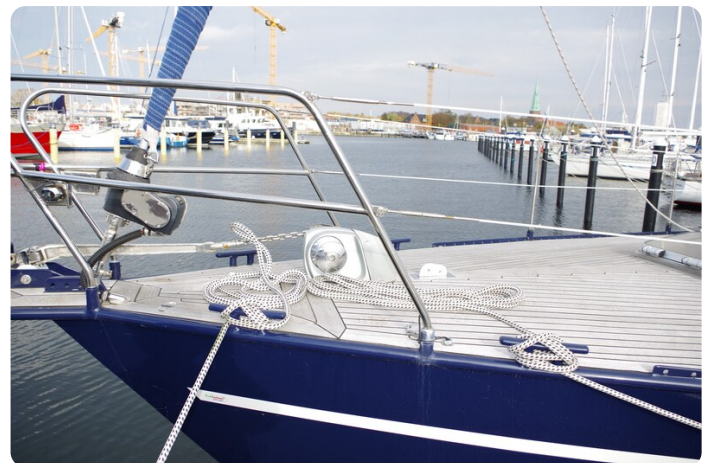
SKORPION II ESTRELLA 9