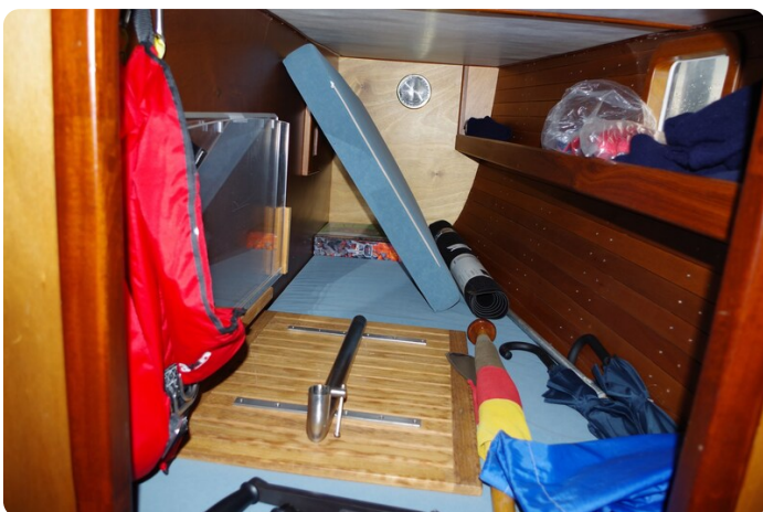
Skorpion II ESTRELLA 54