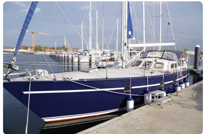
SKORPION II ESTRELLA 15