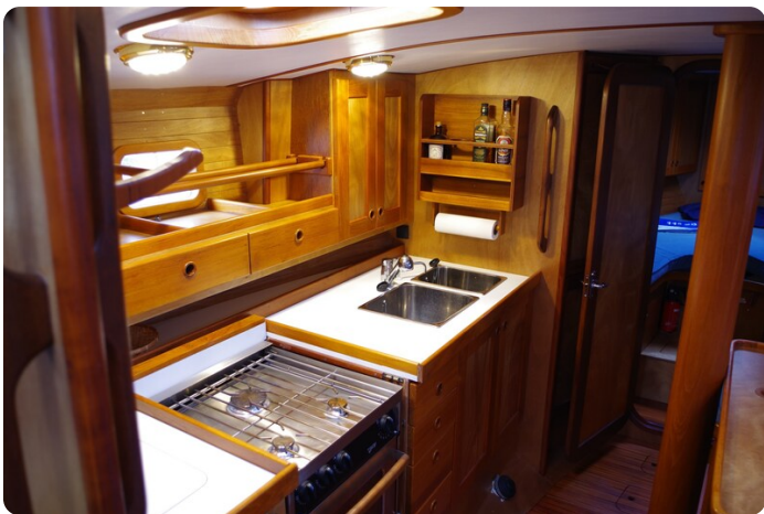
Skorpion II ESTRELLA 33