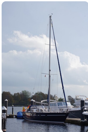
SKORPION II ESTRELLA 21