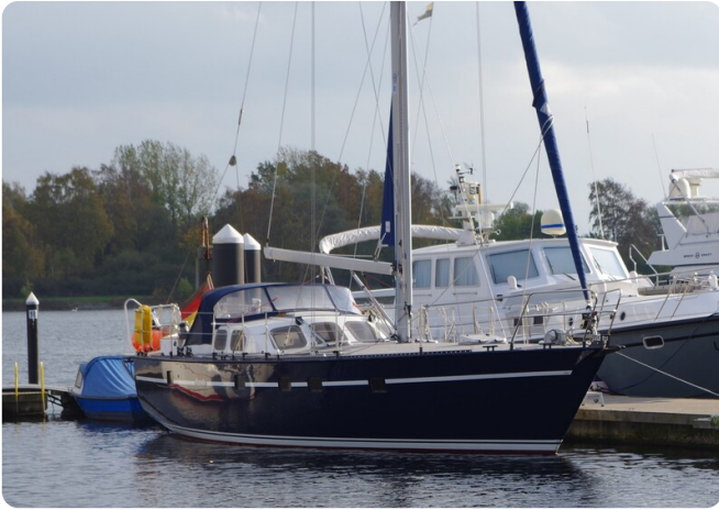
SKORPION II ESTRELLA 20