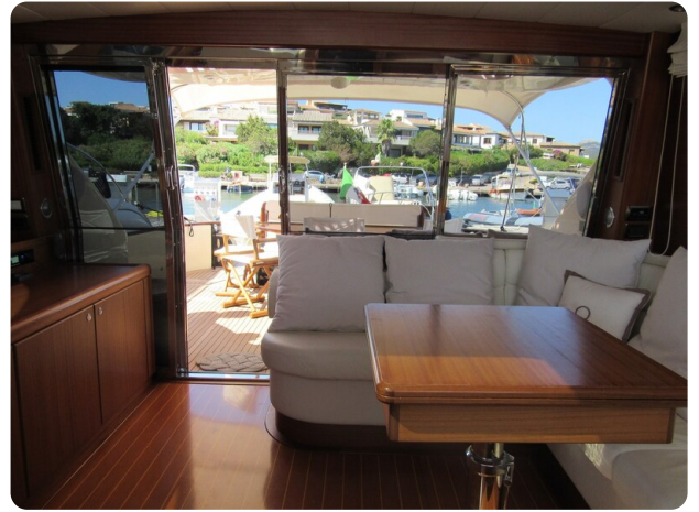
Franchini 55 Emozione, salon to aft