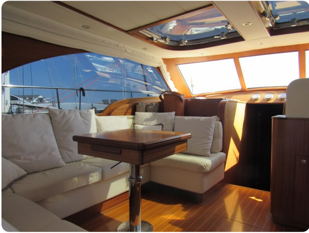
Franchini 55 Emozione, dinette