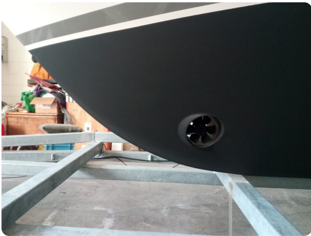
Nelson 24 Open bow thruster