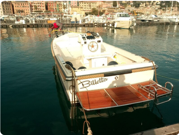
Nelson 24 Open stern view