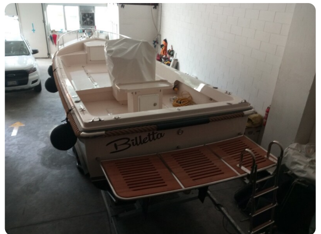
Nelson 24 in rimessaggio