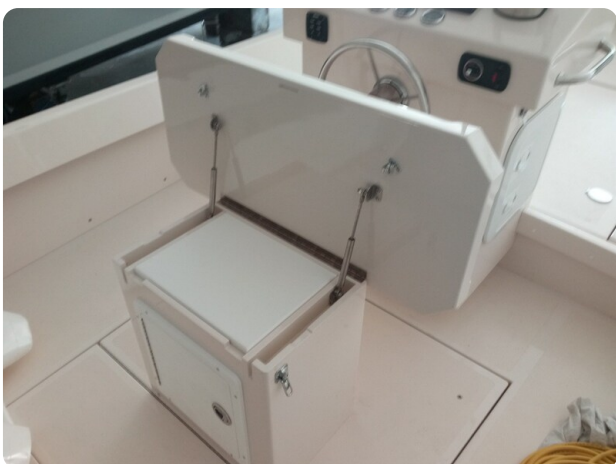
Nelson 24 mobile pozzetto