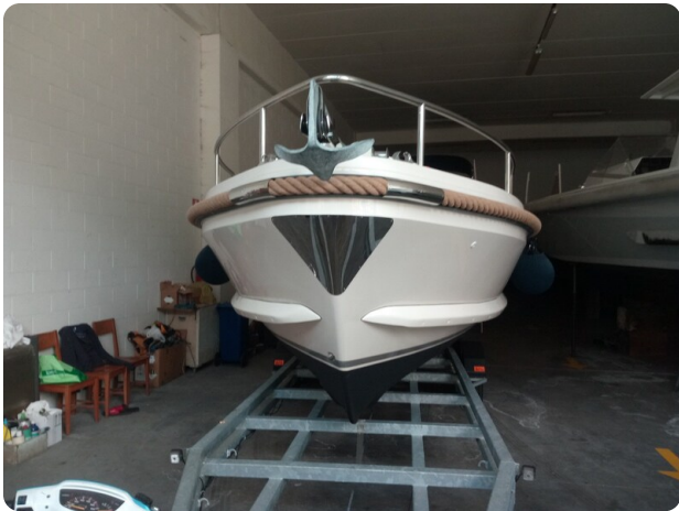
Nelson 24 prua