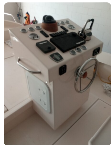
Nelson 24 Open console