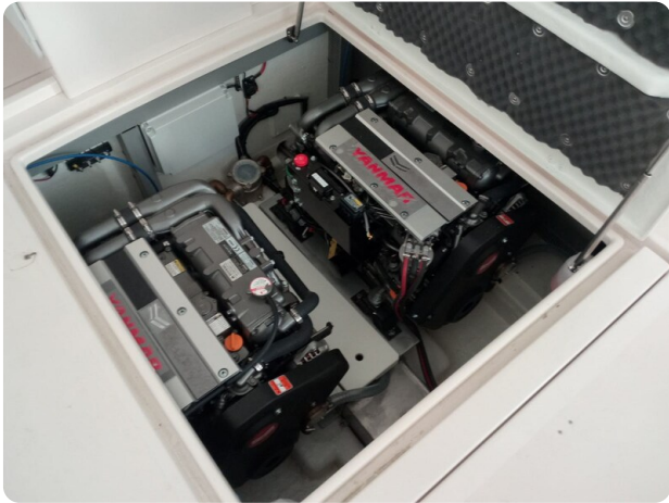
Nelson 24 Open engine room