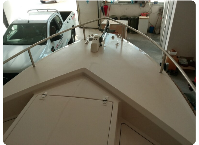
Nelson 24 verricello