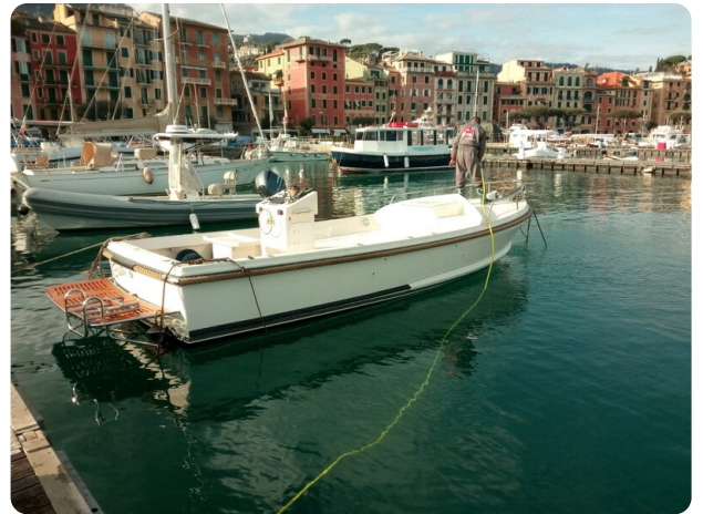
Nelson 24 Open aft profile