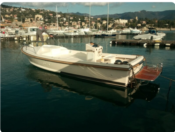
Nelson 24 Open profile