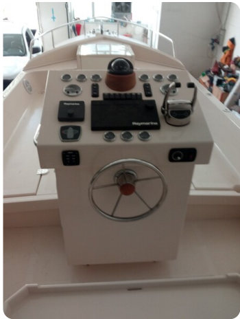
Nelson 24 helm