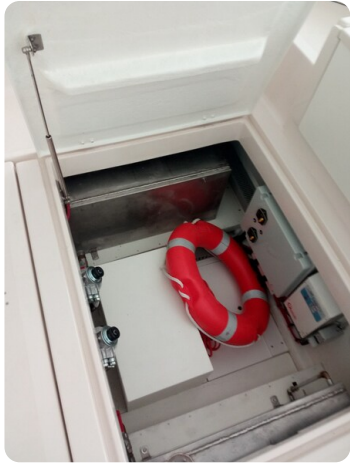
Nelson 24 storage