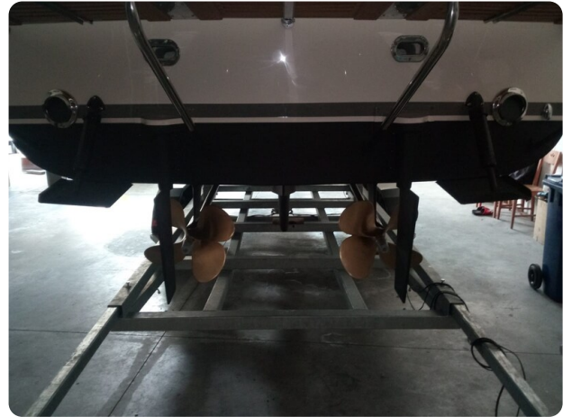
Nelson 24 Open props