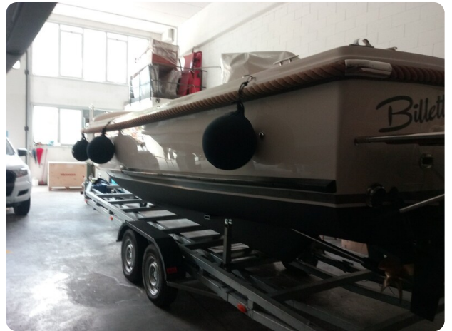
Nelson 24 dettagli 2