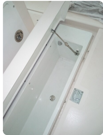
Nelson 24 vasca del vivo