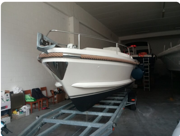
Nelson 24 Open bow