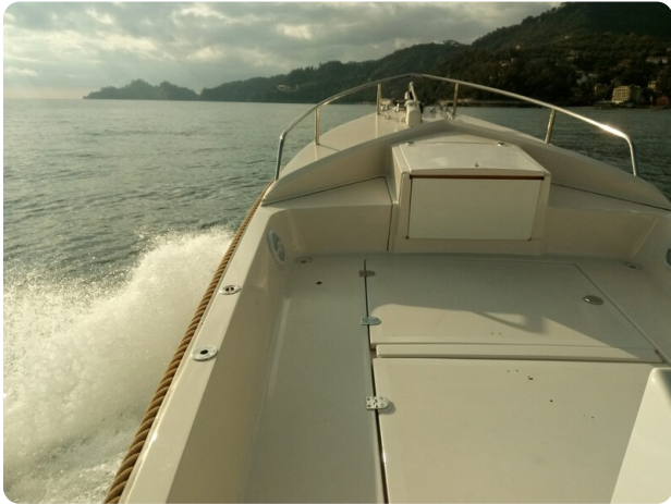
Nelson 24 Open cruising