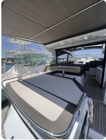
Galeon 485 HTS cockpit sunpad