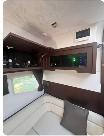
Galeon 485 HTS dinette detail