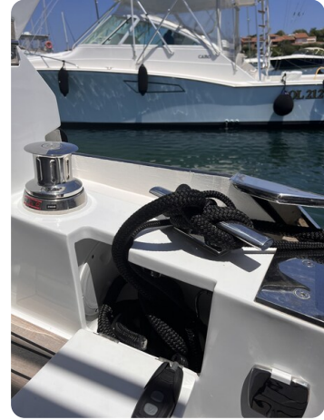
Galeon 485 HTS cockpit winch