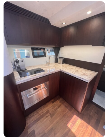
Galeon 485 HTS galley