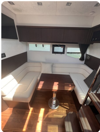
Galeon 485 HTS dinette