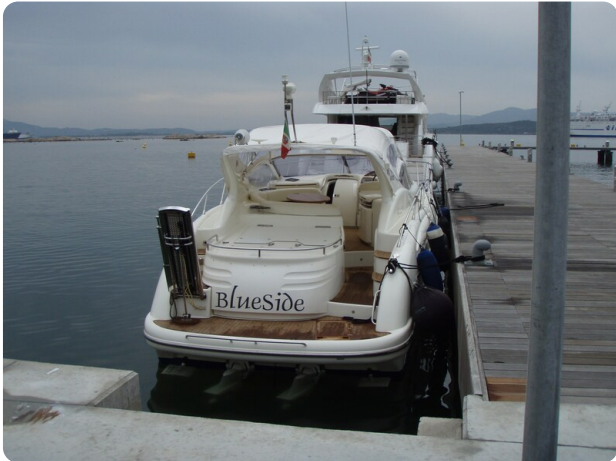
Gobbi 425 esterno (5)