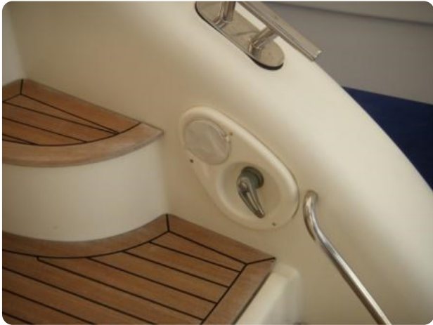
Gobbi 425 esterno (7)