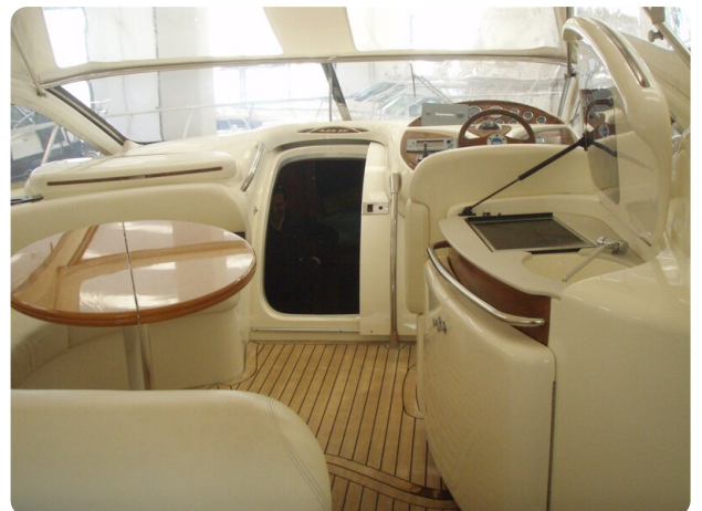
Gobbi 425 interno