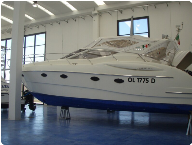
Gobbi 425 esterno