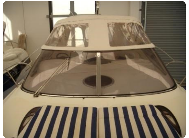
Gobbi 425 esterno (9)