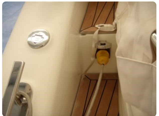
Gobbi 425 esterno (8)