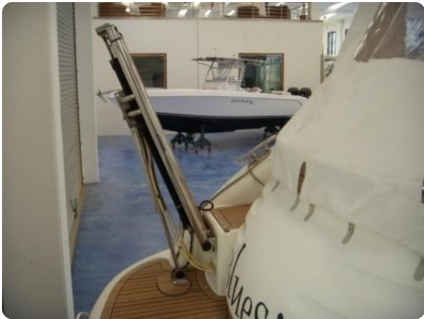
Gobbi 425 esterno (12)