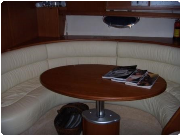
Gobbi 425 (5)