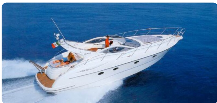
Gobbi sister ship