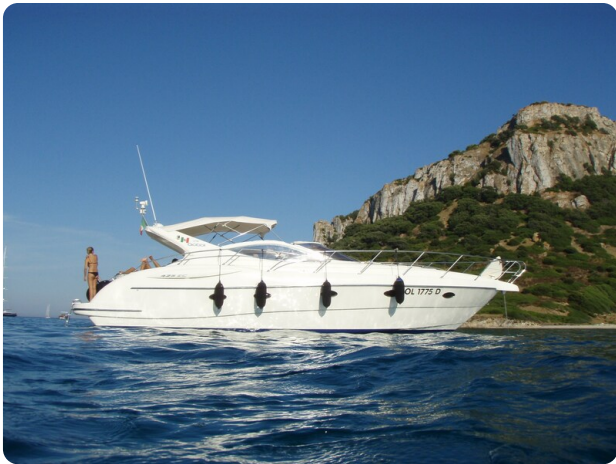
Gobbi 425 esterno (1)