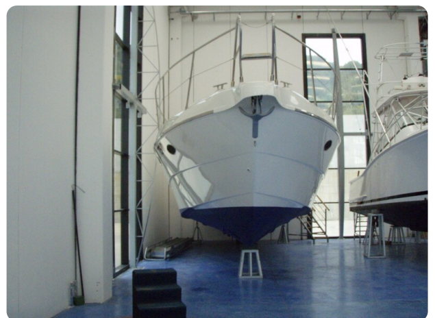
Gobbi 425 esterno (6)