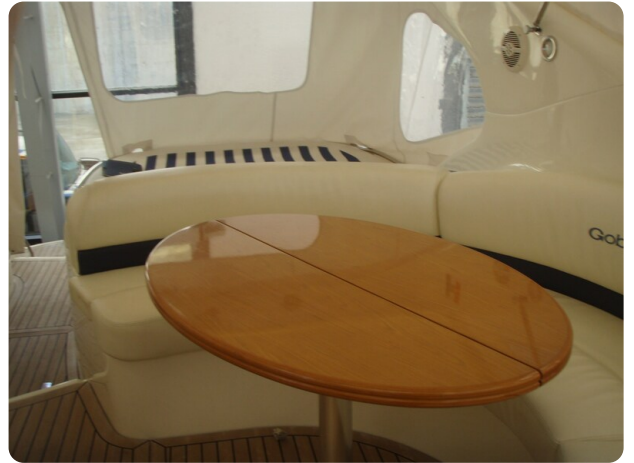
Gobbi 425 (1)