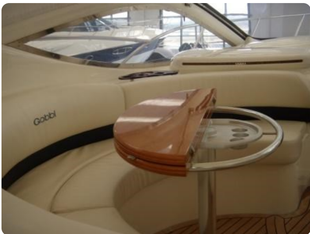
Gobbi 425 (6)