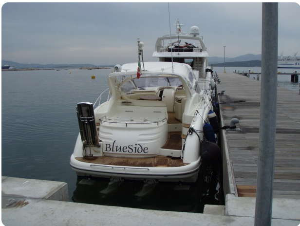
Gobbi 425 esterno (5)