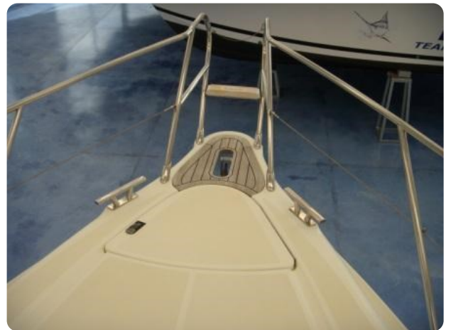
Gobbi 425 esterno (11)