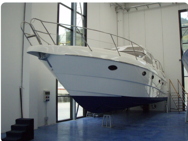
Gobbi 425 esterno (4)