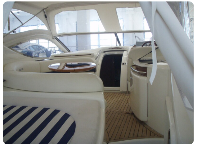
Gobbi 425 esterno