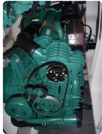
Gobbi 425 motori