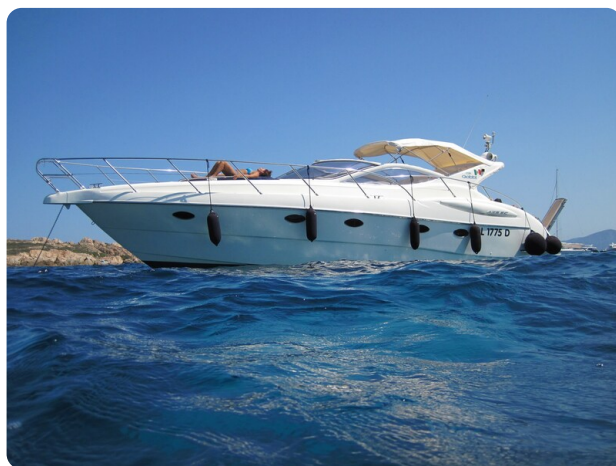
Gobbi 425 esterno (2)