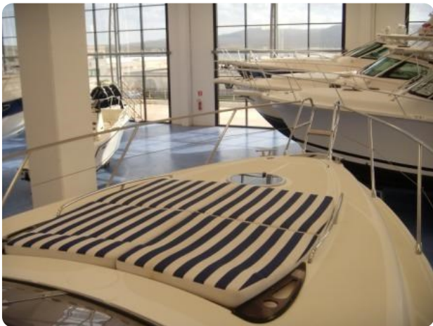
Gobbi 425 esterno (10)