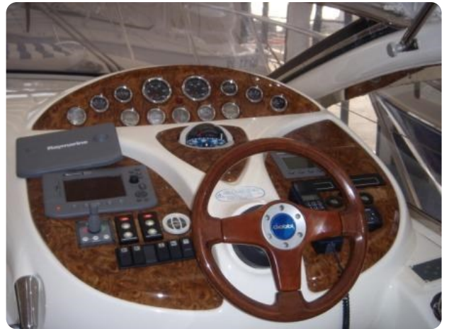
Gobbi 425 (3)