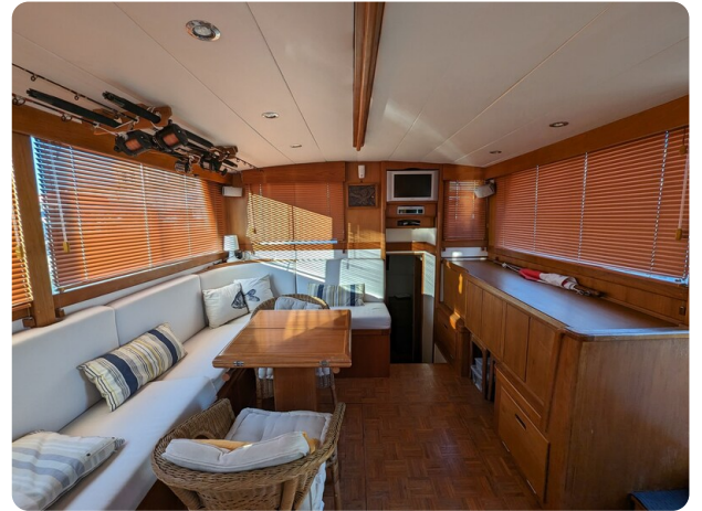
Grand Banks 42 Classic salon2