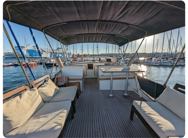
Grand Banks 42 Classic Fly dinette