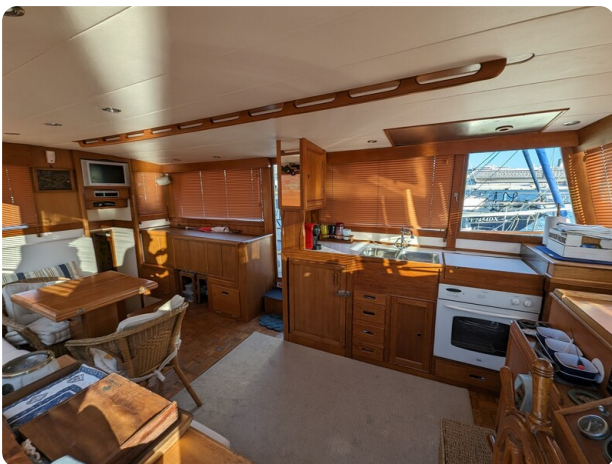
Grand Banks 42 Classic salon view