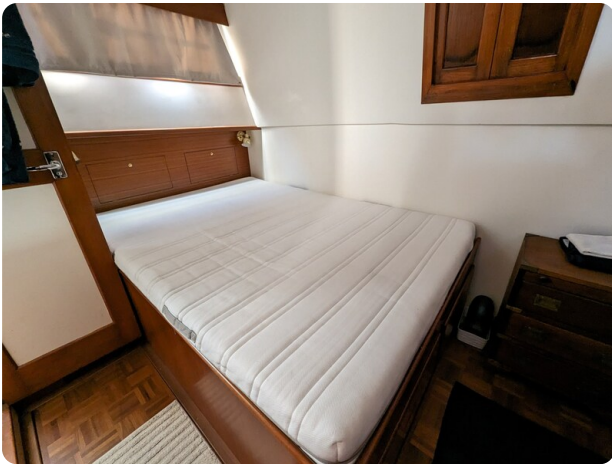
Grand Banks 42 Classic owner's cabin