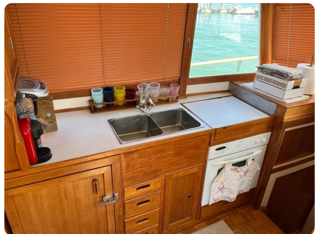
Grand Banksgalley 42 Classic