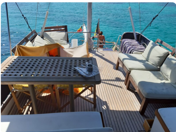
Grand Banks 42 Classic Fly view