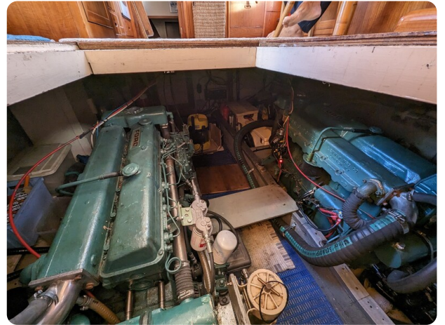
Grand Banks 42 Classic engine room