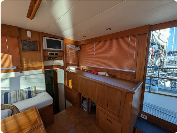
Grand Banks 42 Classic dinette detail