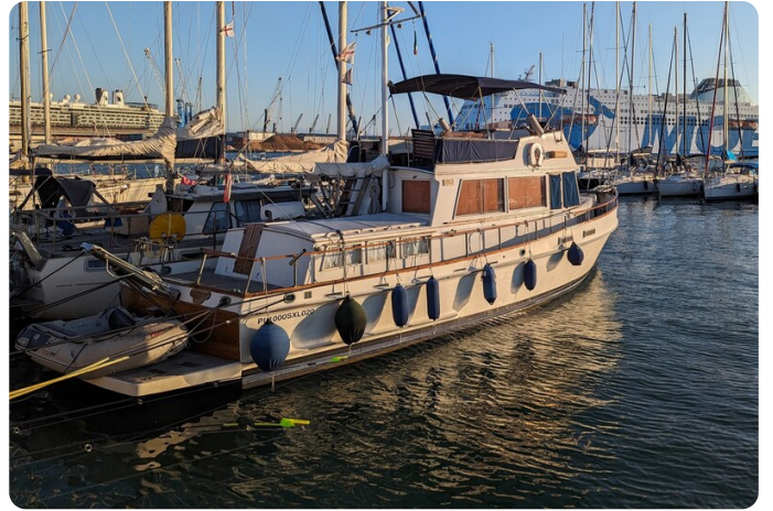
Grand Banks 42 Classic aft view