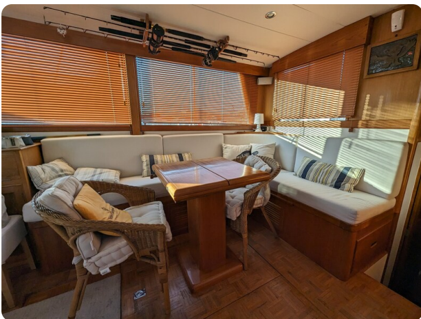
Grand Banks 42 Classic dinette