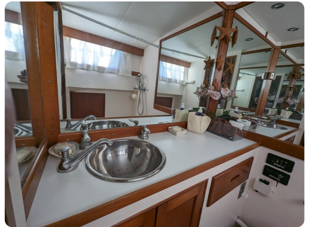
Grand Banks 42 Classic owner's bathroom