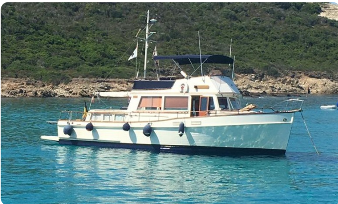
Grand Banks 42 Classic anchored