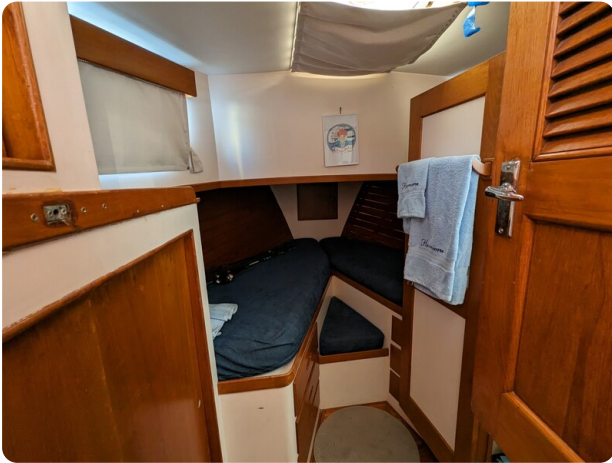
Grand Banks 42 Classic guest cabin