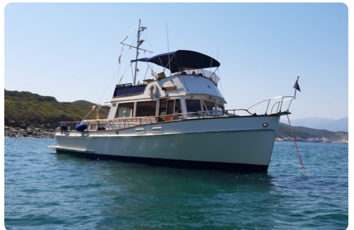
Grand Banks 42 Classic bow view