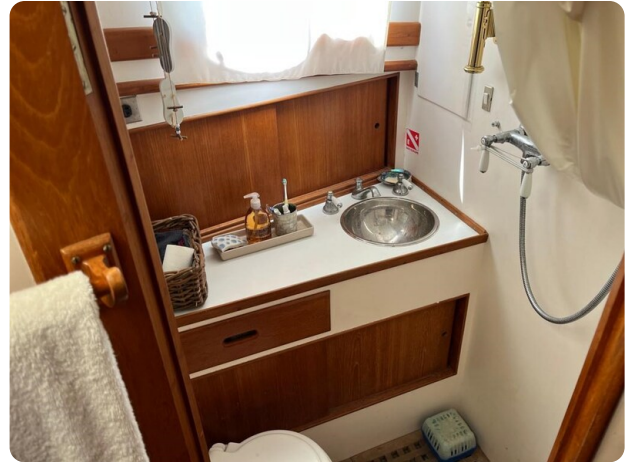
Grand Banks 42 Classic bathroom