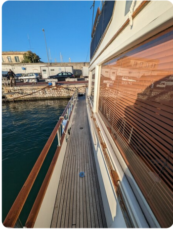
Grand Banks 42 Classic sideways