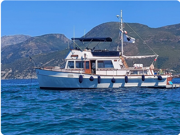
Grand Banks 42 Classic profile