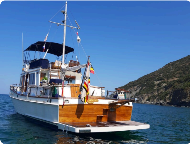
Grand Banks 42 Classic aft view