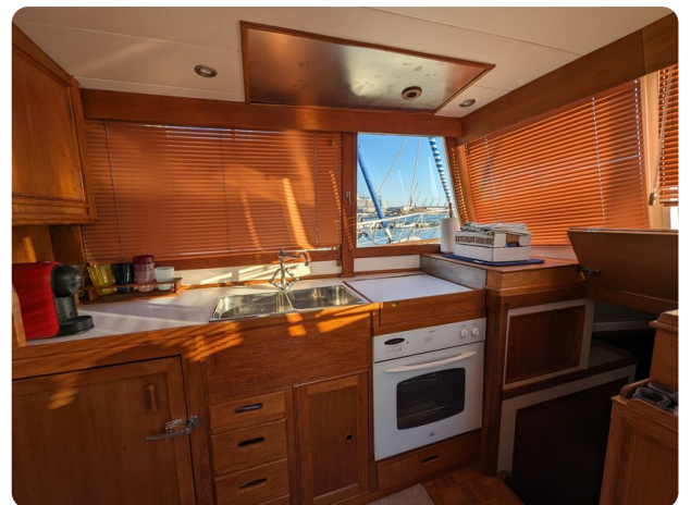
Grand Banks 42 Classic galley