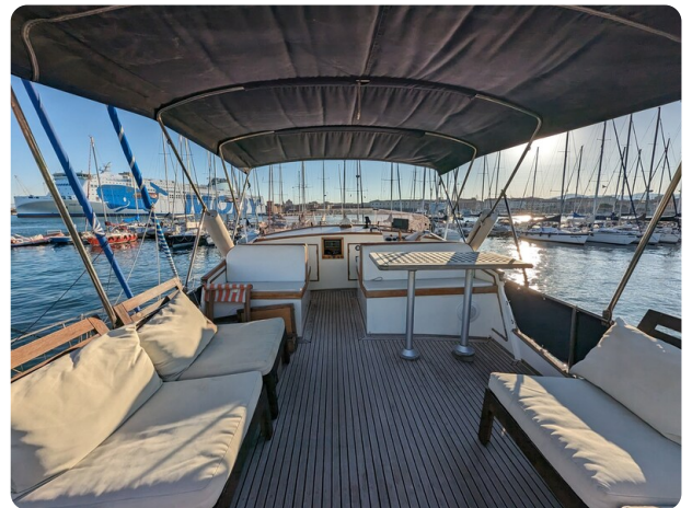
Grand Banks 42 Classic Fly dinette