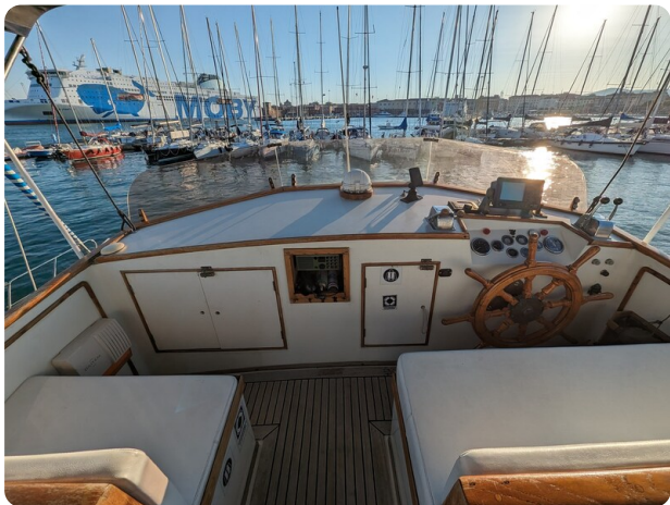
Grand Banks 42 Classic Fly helm station