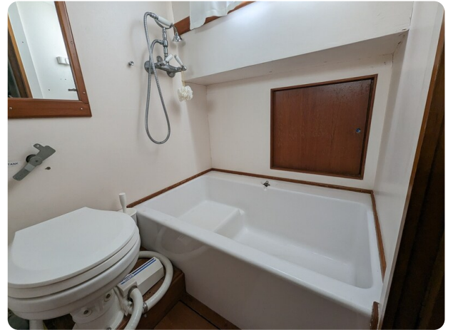
Grand Banks 42 Classic bathroom