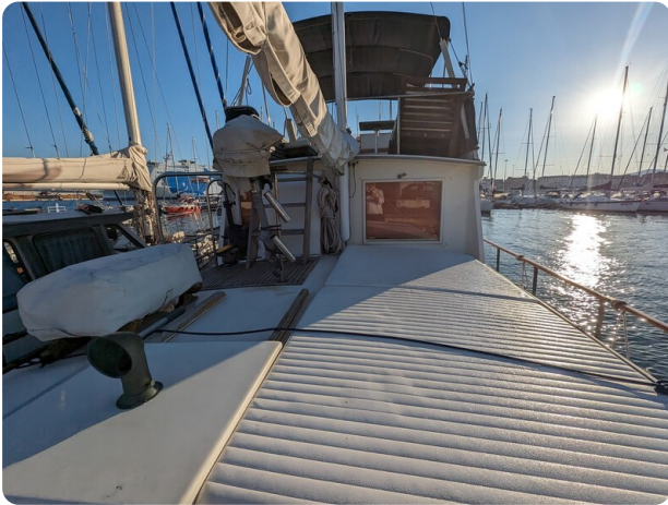
Grand Banks 42 Classic aft deck sunpad