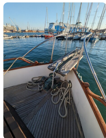
Grand Banks 42 Classic bow pulpit