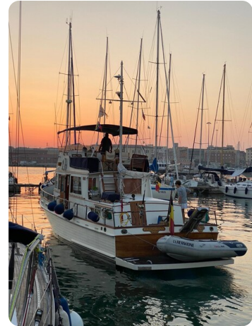
Grand Banks 42 sunset