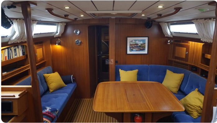
Hallberg Rassy 48 AURORA 20