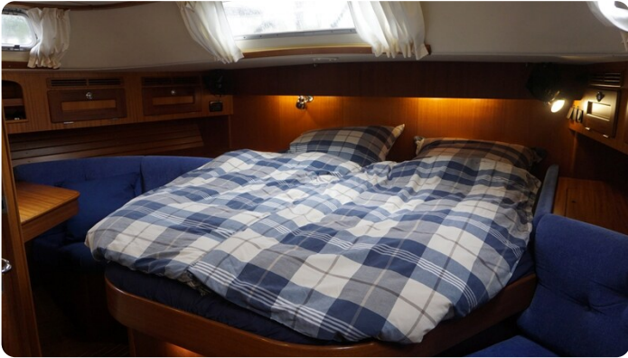
Hallberg Rassy 48 AURORA 31