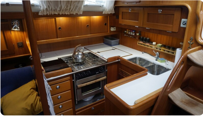
Hallberg Rassy 48 AURORA 23