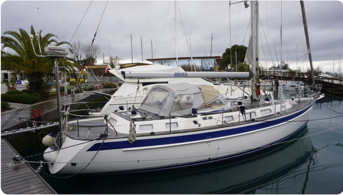
Hallberg Rassy 48 AURORA 1