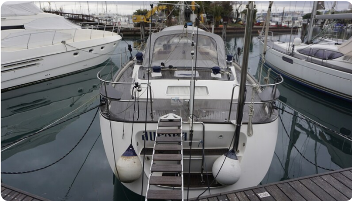
Hallberg Rassy 48 AURORA 3