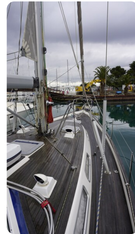
Hallberg Rassy 48 AURORA 5