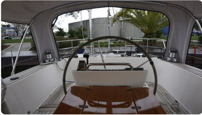
Hallberg Rassy 48 AURORA 19