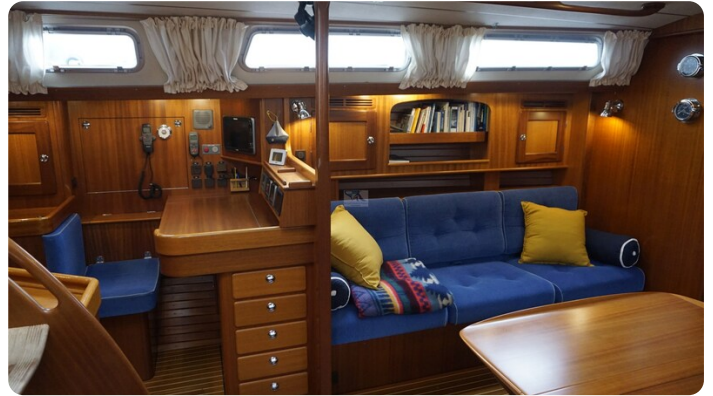
Hallberg Rassy 48 AURORA 26