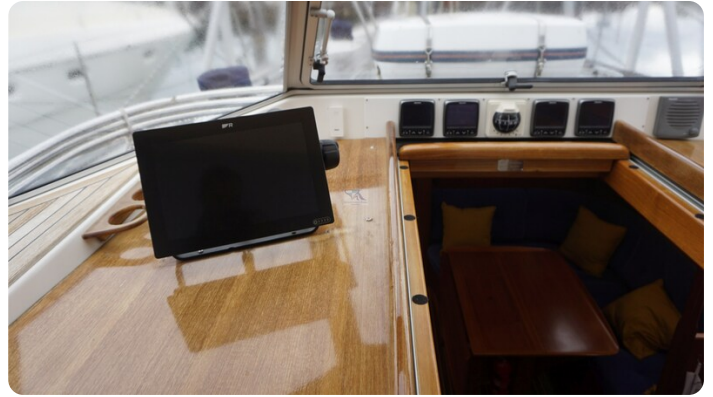
Hallberg Rassy 48 AURORA 67