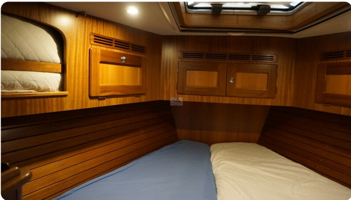
Hallberg Rassy 48 AURORA 39