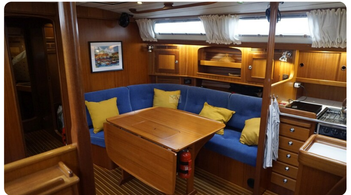
Hallberg Rassy 48 AURORA 51