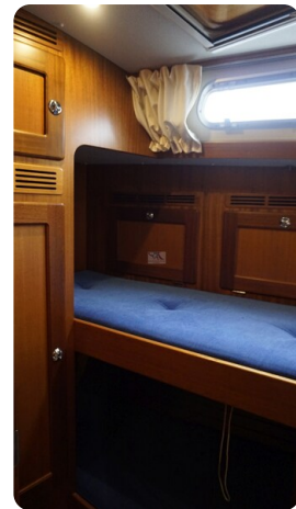
Hallberg Rassy 48 AURORA 42