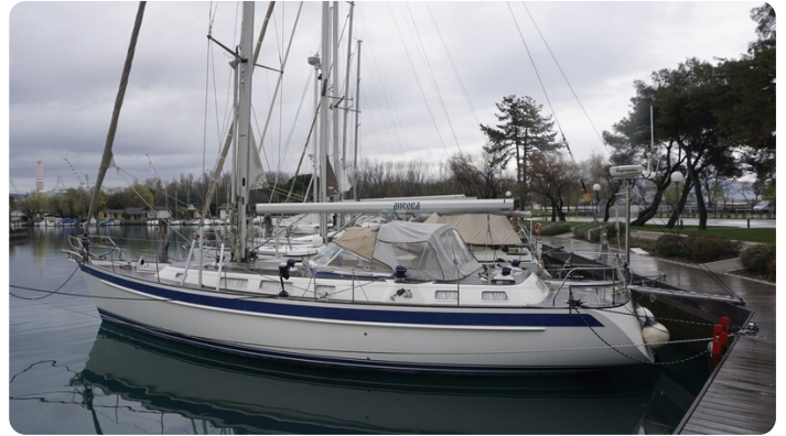
Hallberg Rassy 48 AURORA 2