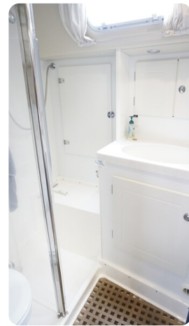
Hallberg Rassy 48 AURORA 34