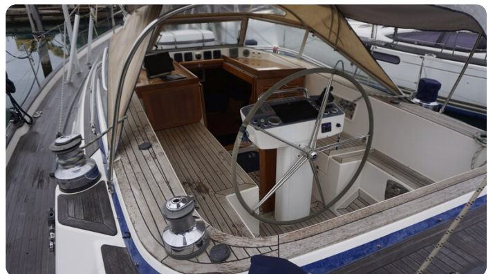
Hallberg Rassy 48 AURORA 65