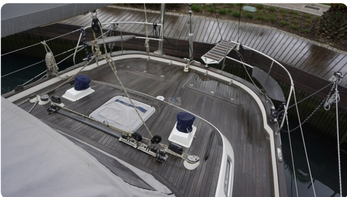
Hallberg Rassy 48 AURORA 11