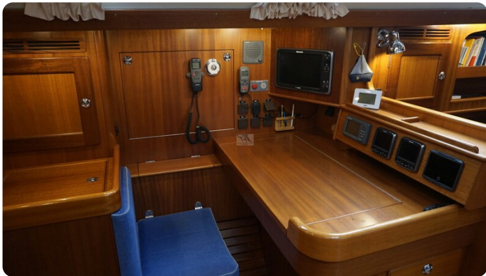
Hallberg Rassy 48 AURORA 27