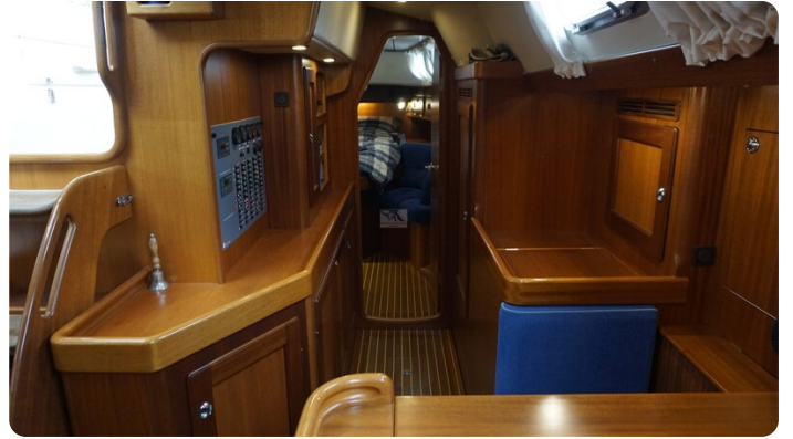
Hallberg Rassy 48 AURORA 28