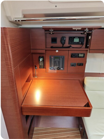
Hanse 418 EDGE 26