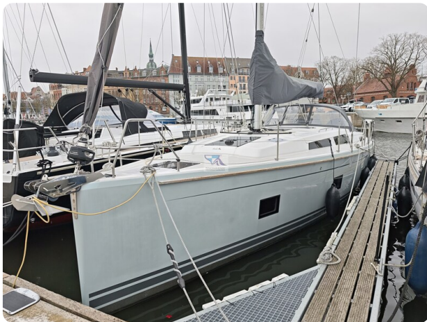
Hanse 418 EDGE 2