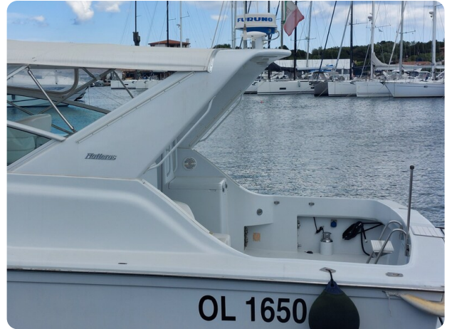
Hatteras 39 Express rollbar detail