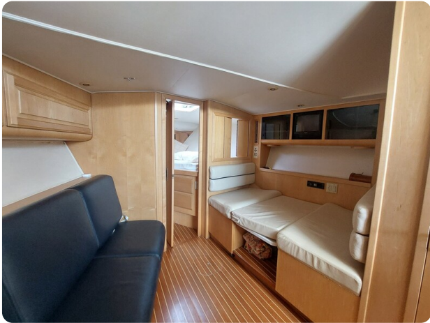
Hatteras 39 Express dinette