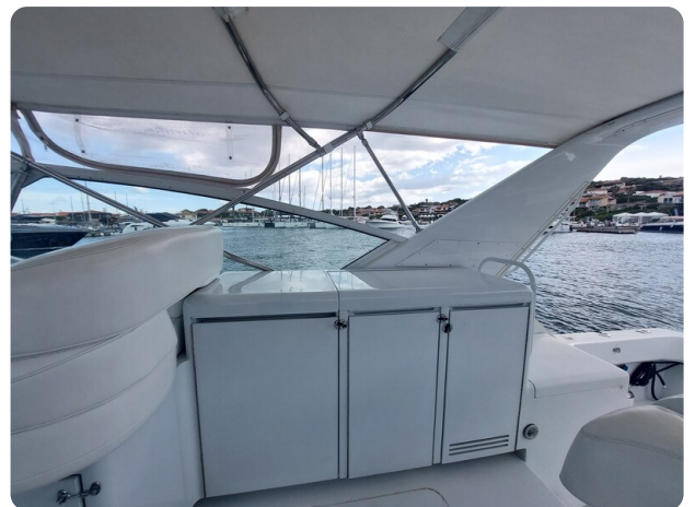
Hatteras 39 Express cockpit bar & sink