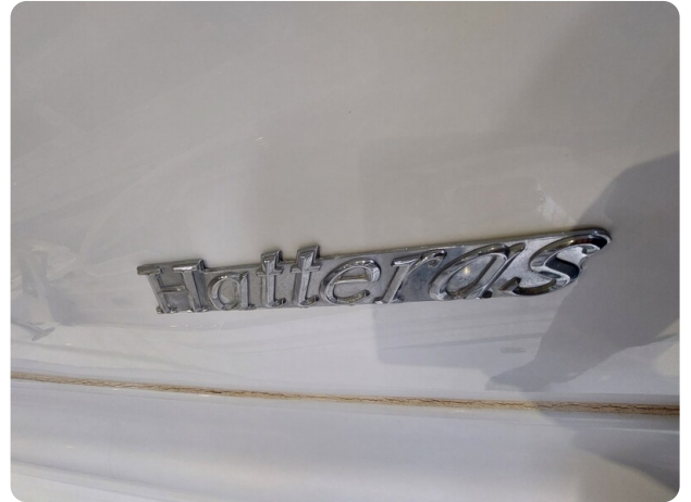
Hatteras 39 express -11