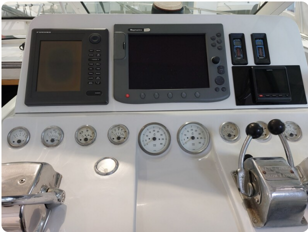
Hatteras 39 express helm detail