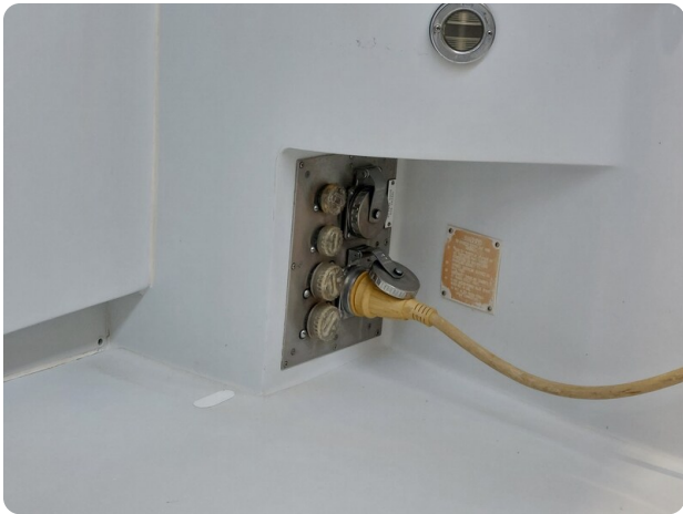
Hatteras 39 Express shore power