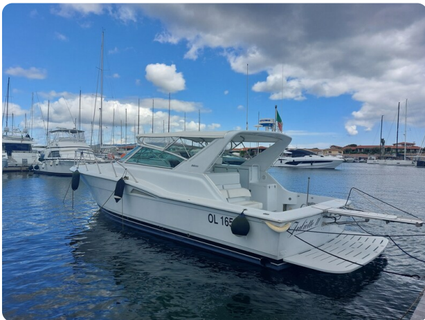
Hatteras 39 Express aft profile