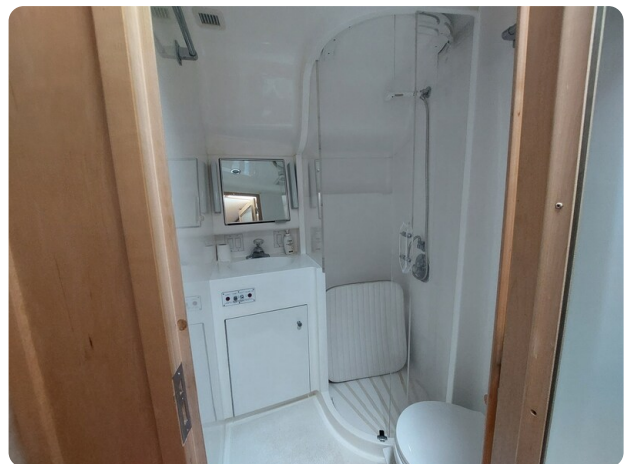
Hatteras 39 Express bathroom