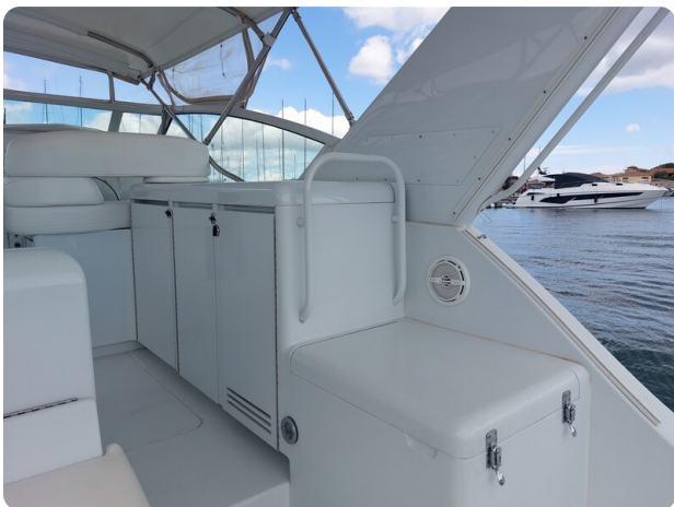
Hatteras 39 Express details