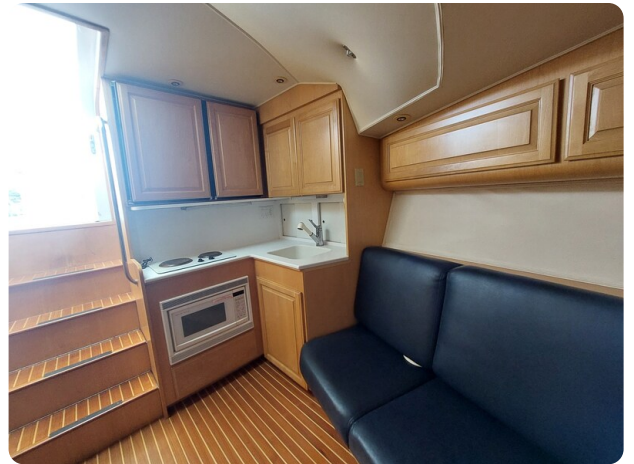
Hatteras 39 Express galley