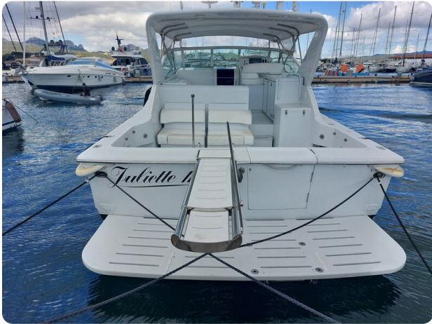
Hatteras 39 Express stern view