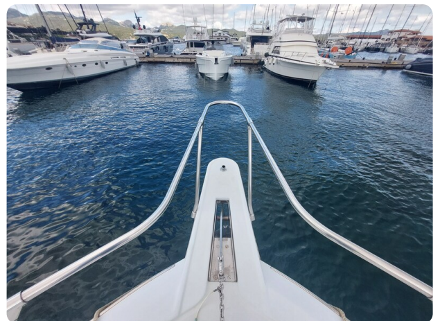
Hatteras 39 Express bow pulpit