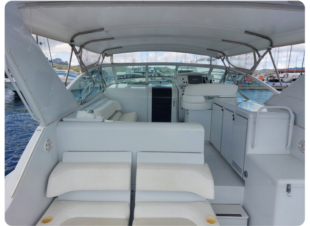
Hatteras 39 Express cockpit detail