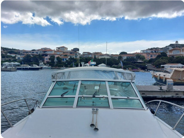
Hatteras 39 Express fwd deck