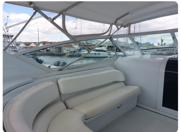
Hatteras 39 Express cockpit dinette