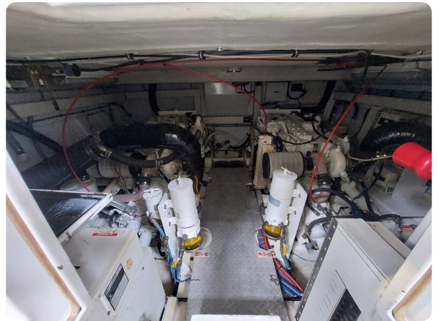
Hatteras 39 Express engine room