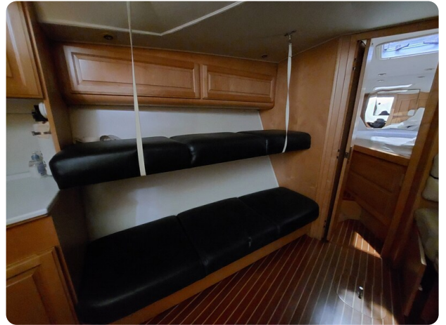
Hatteras 39 Express Conv dinette