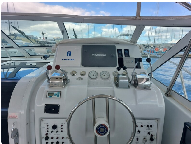
Hatteras 39 Express helm