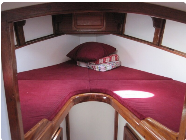
V-Koje 65 Pro