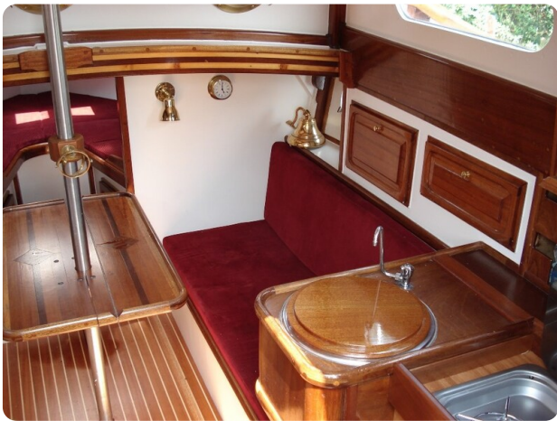
Salon BB 70 proz