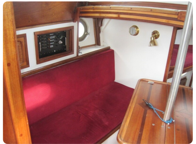
Salon BB Seite