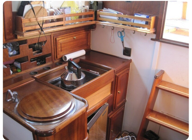
Pantry 60 Proz