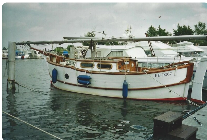
Royal Clipper 2004